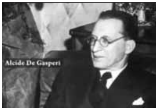
Alcide De Gasperi