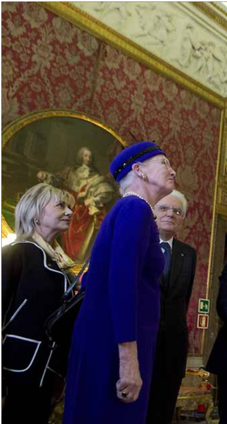
Palazzo del Quirinale, 27 ottobre 2017. Il Presidente della Repubblica Sergio Mattarella e S.M. la Regina di Danimarca Margrethe II.