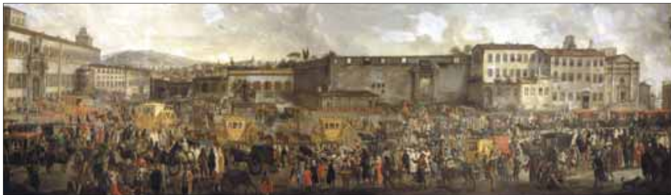
Autore ignoto, Arrivo al Quirinale dell'Ambasciatore veneto Nicola Duodo, 1714, olio su tela, inv. MR 1444. Roma, Museo di Roma © Roma-Sovrintendenza Capitolina ai Beni Culturali, Museo di Roma.