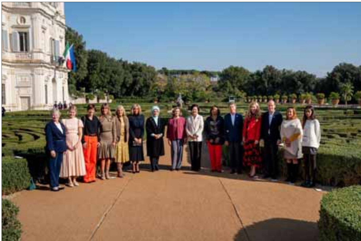
Le First Ladies del G.20 a Villa Doria Pamphilj.