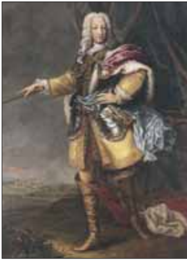
Re Carlo Emanuele III di Savoia. Ritratto di ignoto, 1750 circa. Ambasciata d'Italia a Londra.