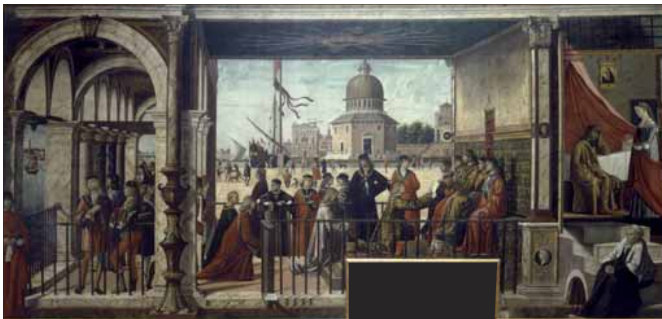
Vittore Carpaccio (Venezia 1465 ca. - 1526). Arrivo degli ambasciatori inglesi alla corte del re di Bretagna. Dipinto eseguito per la scuola di Sant'Orsola di Venezia. Gallerie dell'Accademia di Venezia. Su concessione del Ministero dei Beni e Attività Culturali e del Turismo, Museo Nazionale delle Gallerie dell'Accademia di Venezia.