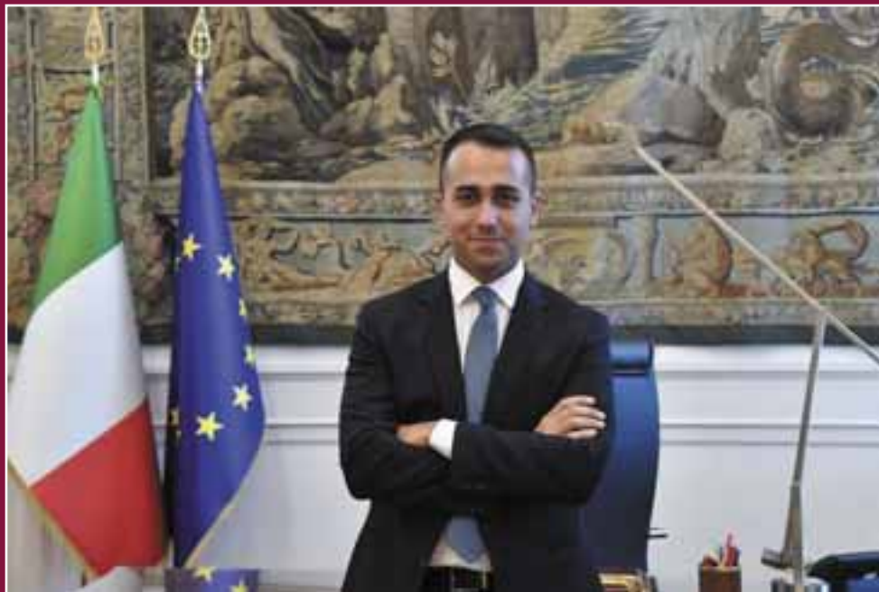
Il Ministro degli Affari Esteri e della Cooperazione Internazionale On. Luigi Di Maio.