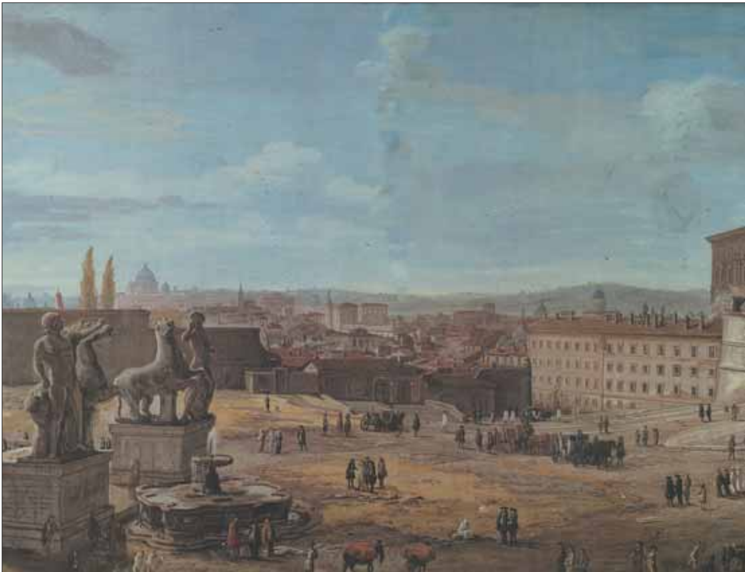
Roma. Veduta della Piazza e del Palazzo di Montecavallo, Gaspar van Wittel, 1682. Musei Capitolini, Pinacoteca Capitolina.