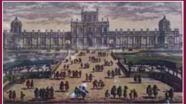
Veduta di Doria Pamphilj in una stampa antica. Collezione privata.