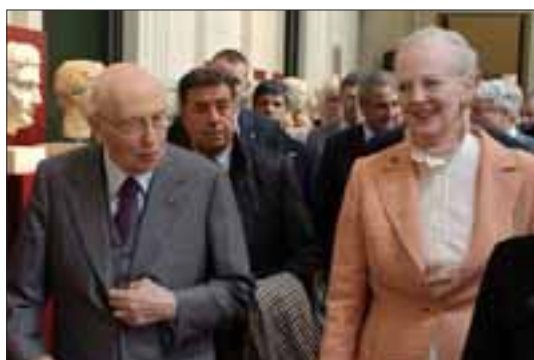
Roma 13 aprile 2012. Il Presidente Giorgio Napolitano con S.M. la Regina di Danimarca Margrethe II, dinanzi ai decoupages realizzati dalla Regina di Danimarca ed esposti alla mostra "I regni immaginari".