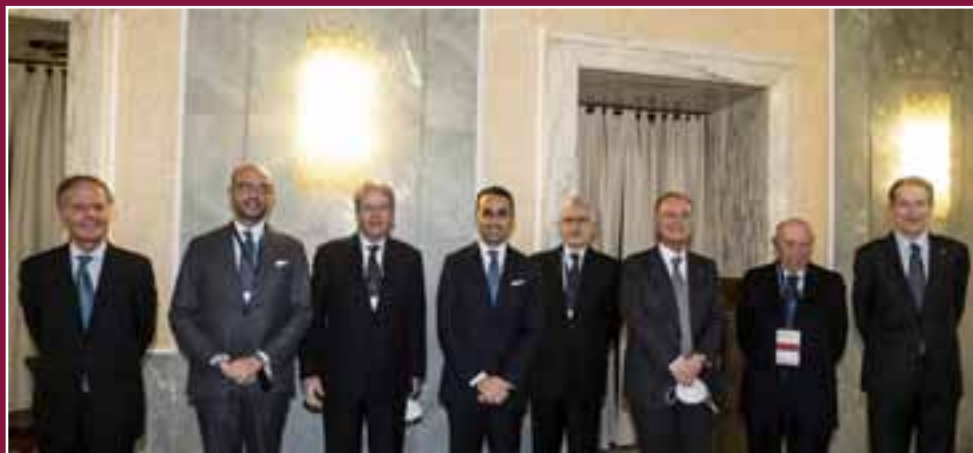
Farnesina, 20 dicembre 2021. XIV Conferenza degli Ambasciatori e delle Ambasciatrici. Da sinistra: i Ministri degli Affari Esteri Moavero Milanesi, Alfano, Gentiloni, Di Maio, D'Alema, Frattini, Dini e Terzi.