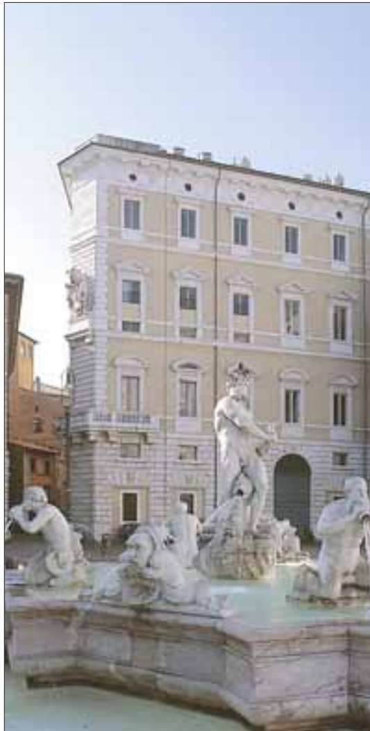
Roma. Palazzo Braschi, facciata su Piazza Navona e Fontana del Nettuno.