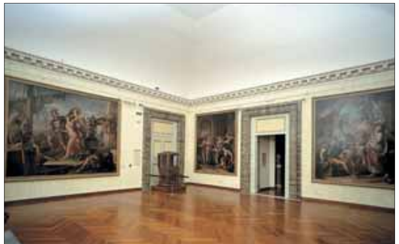
Roma, Palazzo Braschi con una mostra di quadri.