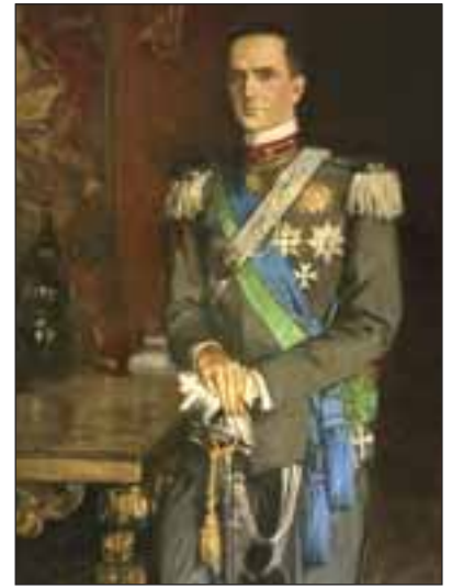
Re Umberto II. Castello di Racconigi. Cuneo.*