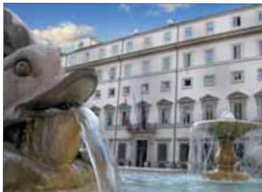
Roma, Palazzo Chigi.