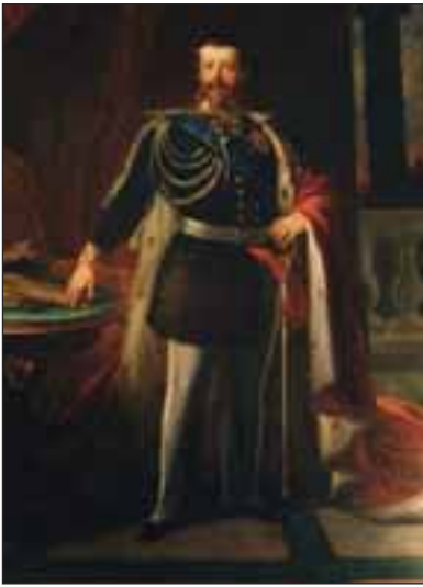
Re Vittorio Emanuele II. F. Bissarra. Museo Nazionale del Risorgimento Italiano. Torino.