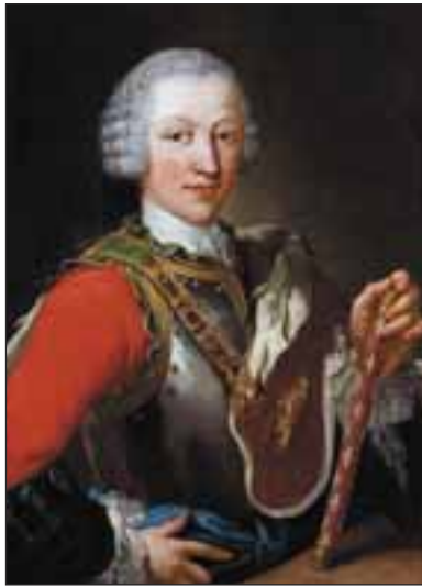
Re Vittorio Amedeo III di Savoia. Domenico Duprà. Reggia di Caserta.