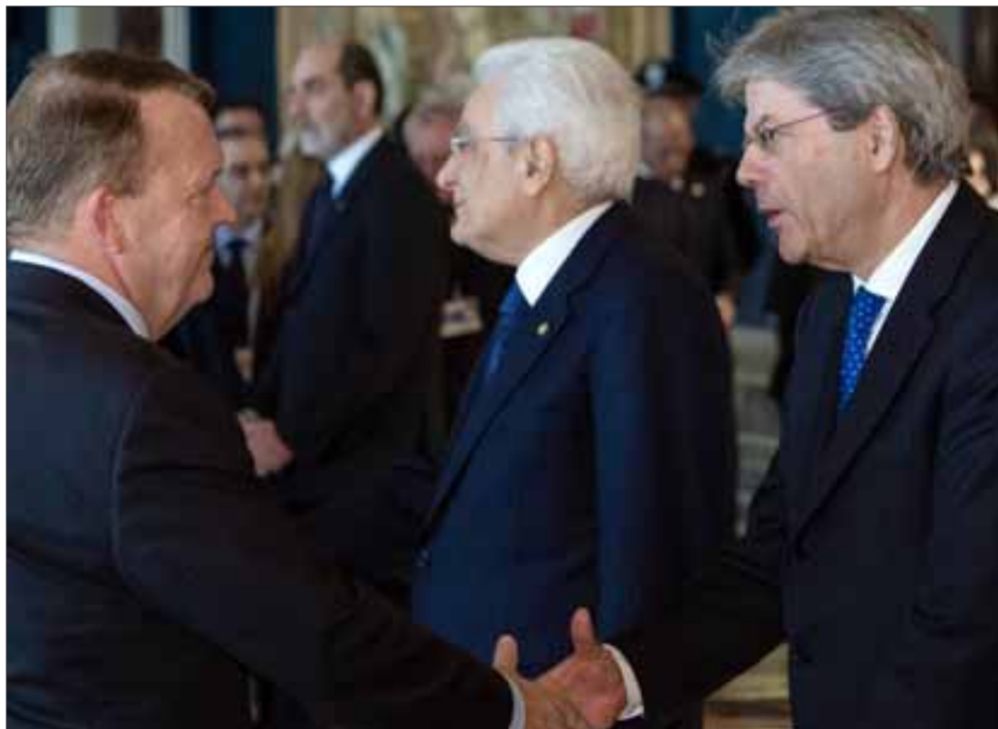
Roma, 25 marzo 2017. Il Presidente del Consiglio Paolo Gentiloni saluta il Primo Ministro del Regno di Danimarca Lars Lokke Rasmussen.