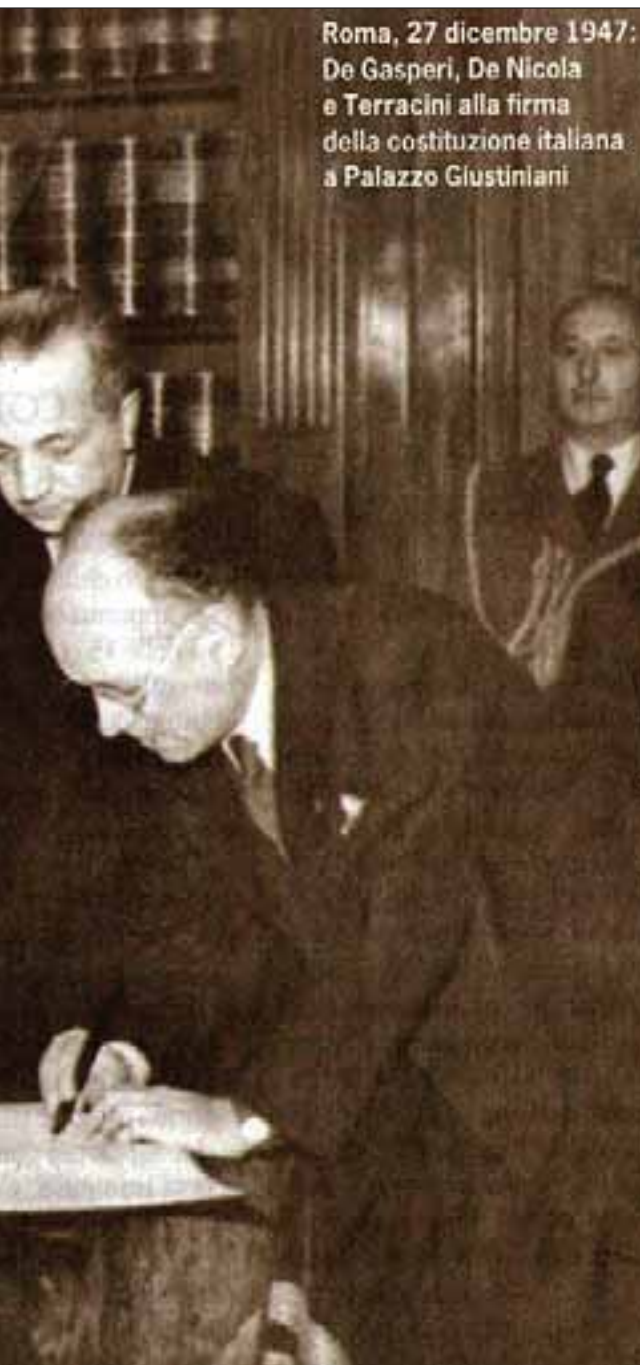
Roma, 27 dicembre 1947: De Gasperi, De Nicola e Terracini alla firma della costituzione italiana a Palazzo Giustiniani