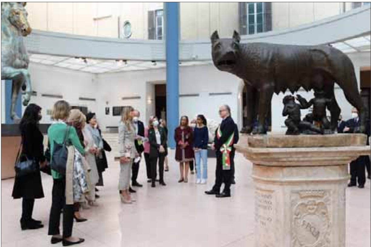
Le First Ladies del G.20 al Campidoglio.