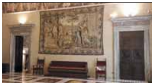
Villa Madama. Sede di Rappresentanza del Ministro degli Affari Esteri e della Cooperazione Internazionale.