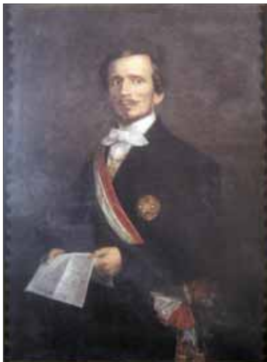
Ritratto di Bettino Ricasoli.