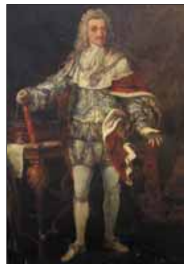
Re Vittorio Amedeo II di Savoia. Collezione privata.