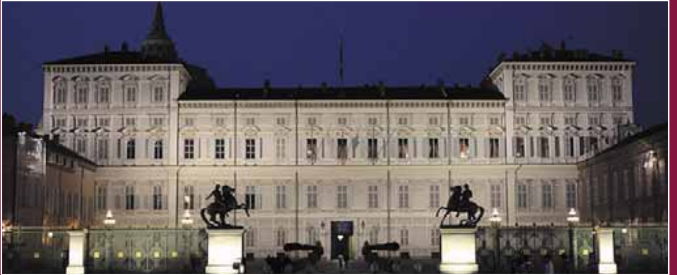
Torino. Palazzo Reale.