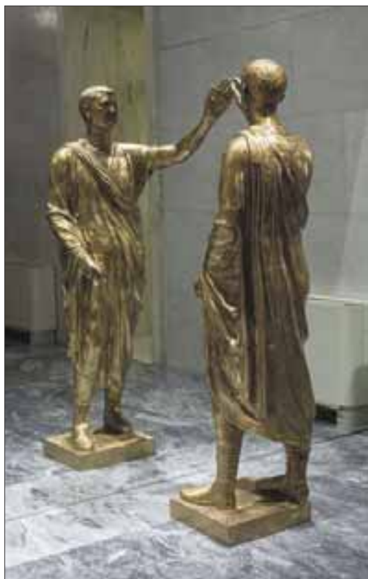
L'etrusco. Michelangel Pistoletto, 1957. Fondazione Pistoletto di Biella. Atrio d'onore. Farnesina. Roma.