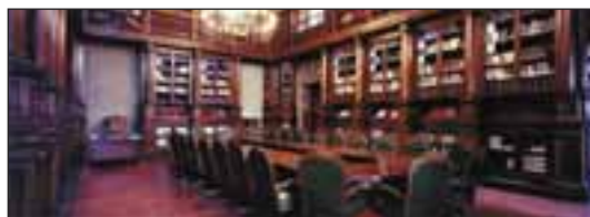
Palazzo Chigi. La Biblioteca Chigiana.