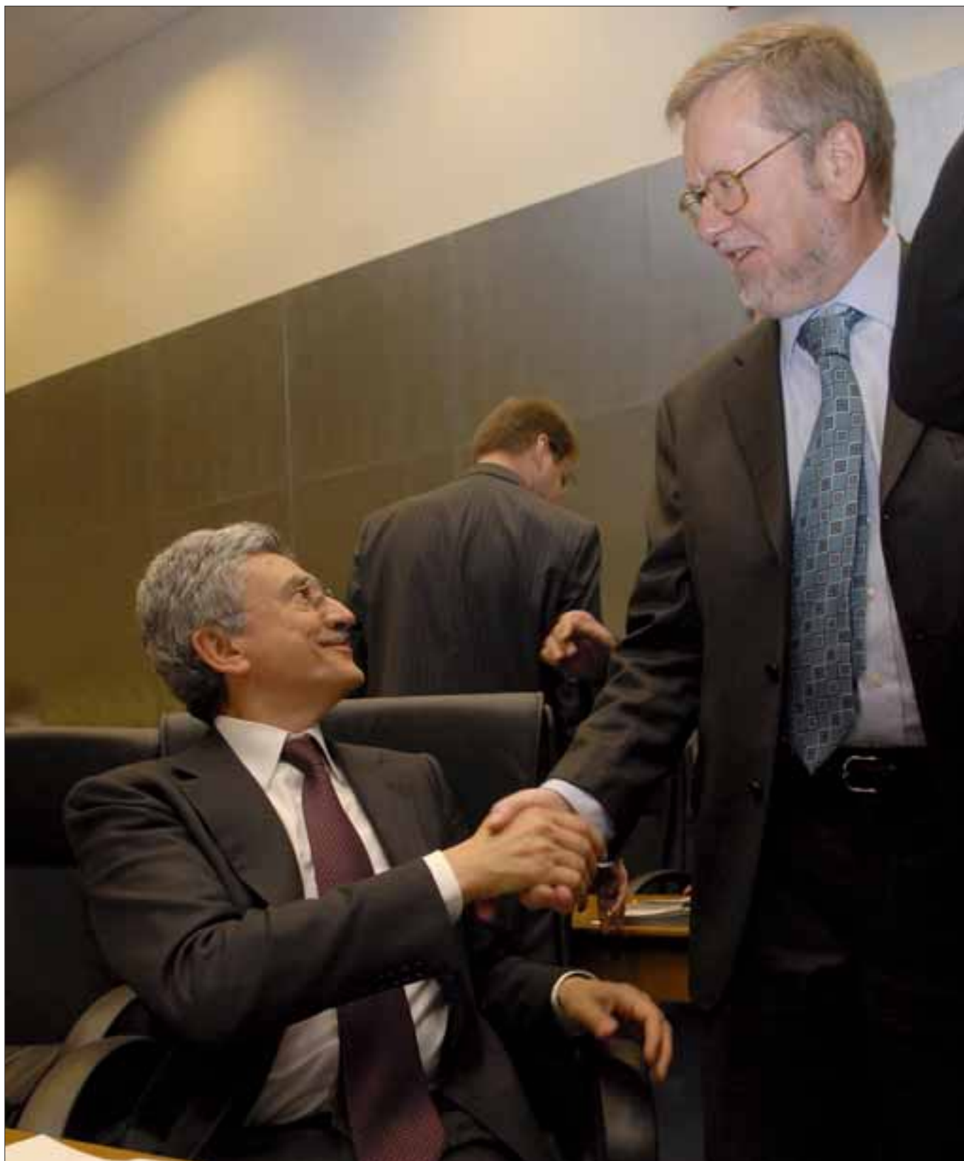
Roma, 7 marzo 2007. Il Vice Presidente del Consiglio e Ministro degli Affari Esteri, Massimo D'Alema, e il Ministro degli Affari Esteri danese, Per Stig Møller.