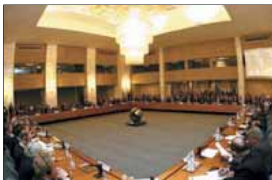
Roma, Farnesina. Sala delle Conferenze Internazionali.