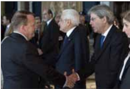
Il Presidente del Consiglio Paolo Gentiloni saluta il Primo Ministro del Regno di Danimarca Lars Lokke Rasmussen.