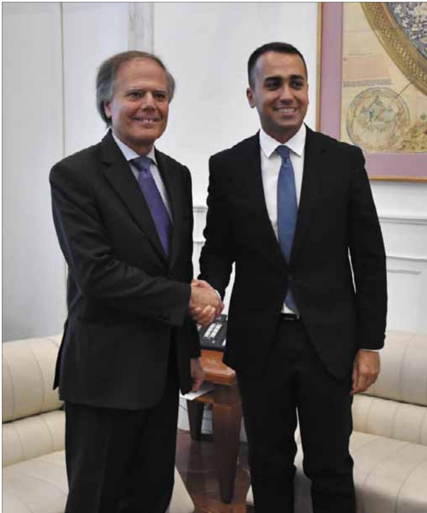
Farnesina, 5 settembre 2019. L'insediamento del Ministro degli Affari Esteri e della Cooperazione Internazionale Luigi Di Maio e il passaggio di consegne con il predecessore Enzo Moavero Milanese.