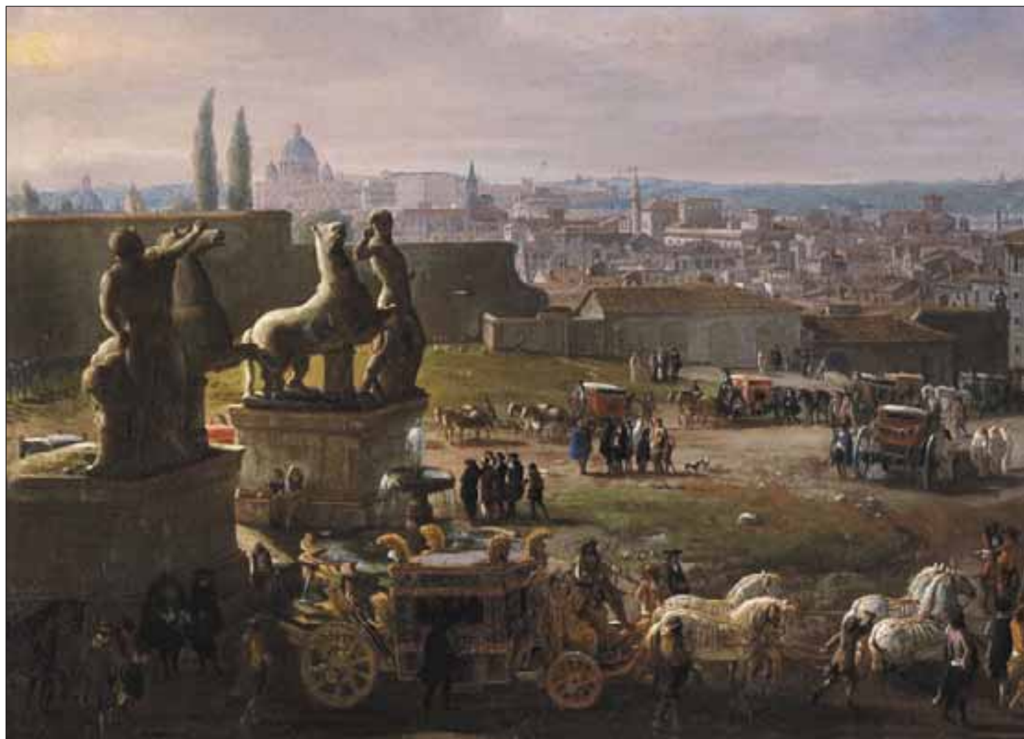
Gaspar van Wittel, Veduta della Piazza e del Palazzo di Montecavallo, 1680-1690 circa, Museo Principi Colonna, Palazzo Colonna. Roma.