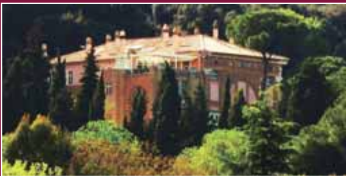
Roma. Villa Madama, Sede di Rappresentanza.