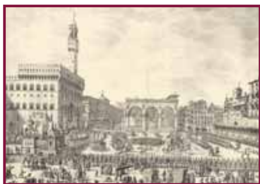
Firenze. Veduta del Palazzo Vecchio (sulla sinistra). Firenze (1865-1871), sede del Ministero degli Affari Esteri.