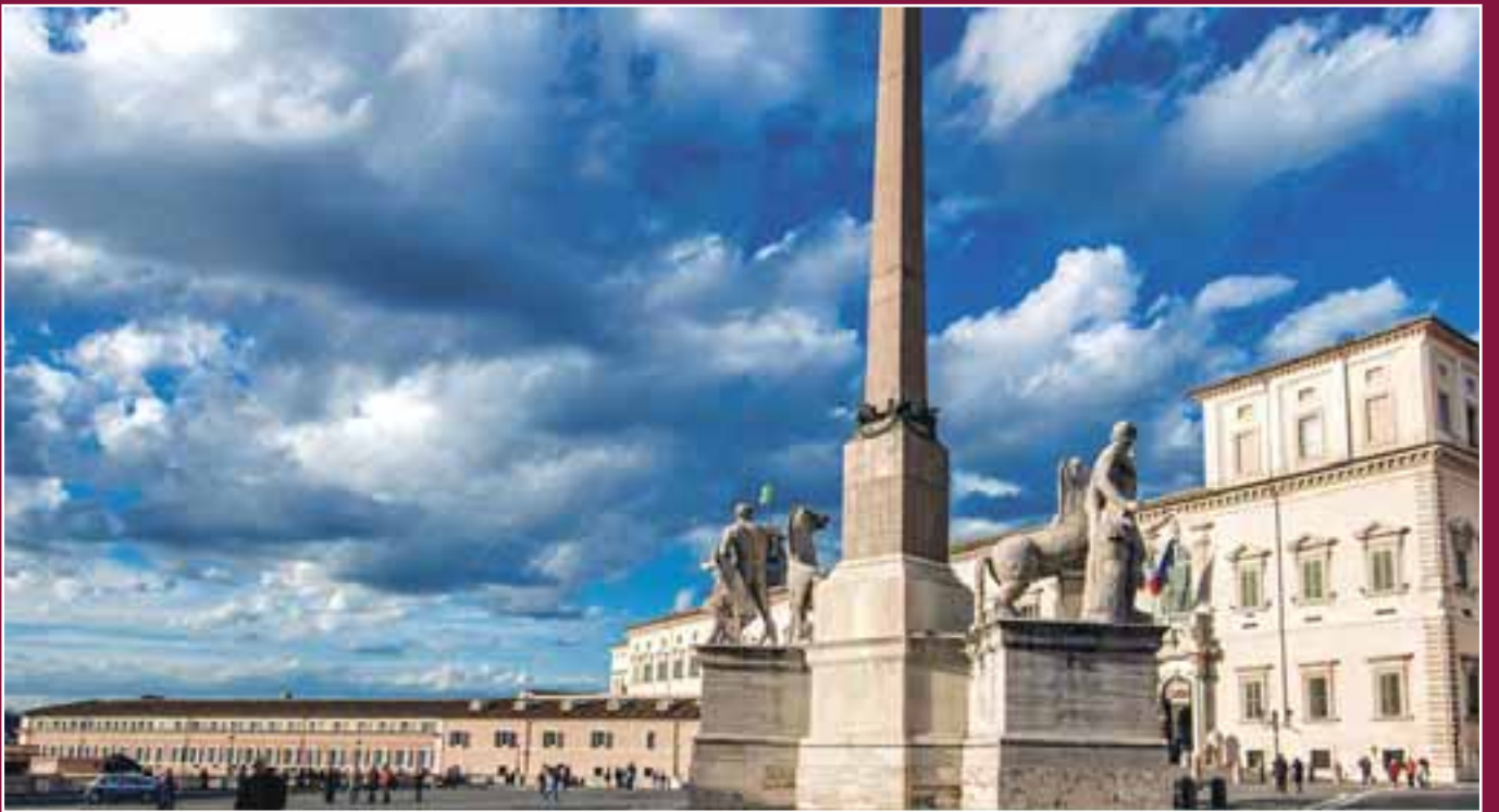
Roma. Piazza del Quirinale.