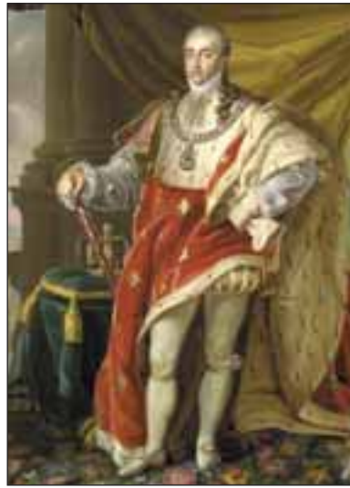
Re Carlo Felice. L. Bernero. Museo Nazionale del Risorgimento Italiano. Torino.