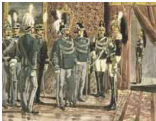
Il Re Vittorio Emanuele II con i Corazzieri al Quirinale.