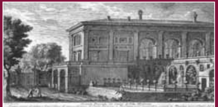
Incisione di Giuseppe Vasi riguardante Villa Madama a Roma.