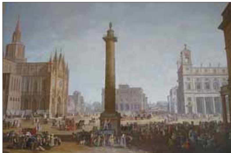
Roma. Farnesina. Veduta di città fantastica – Olio su tela – Anonimo. Sala Contarini – Segreteria Generale.