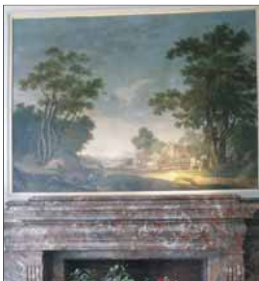
Villa Madama. Ingresso. Particolare.