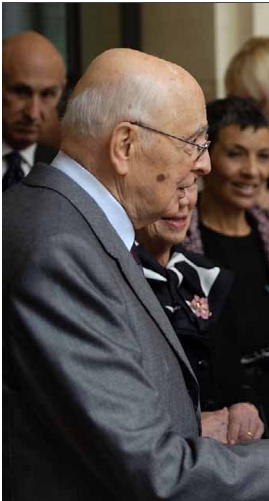
Roma, 13 aprile 2012. Il Presidente Giorgio Napolitano con S.M. la Regina di Danimarca Margrethe II, in occasione dell'inaugurazione della mostra "I regni immaginari".