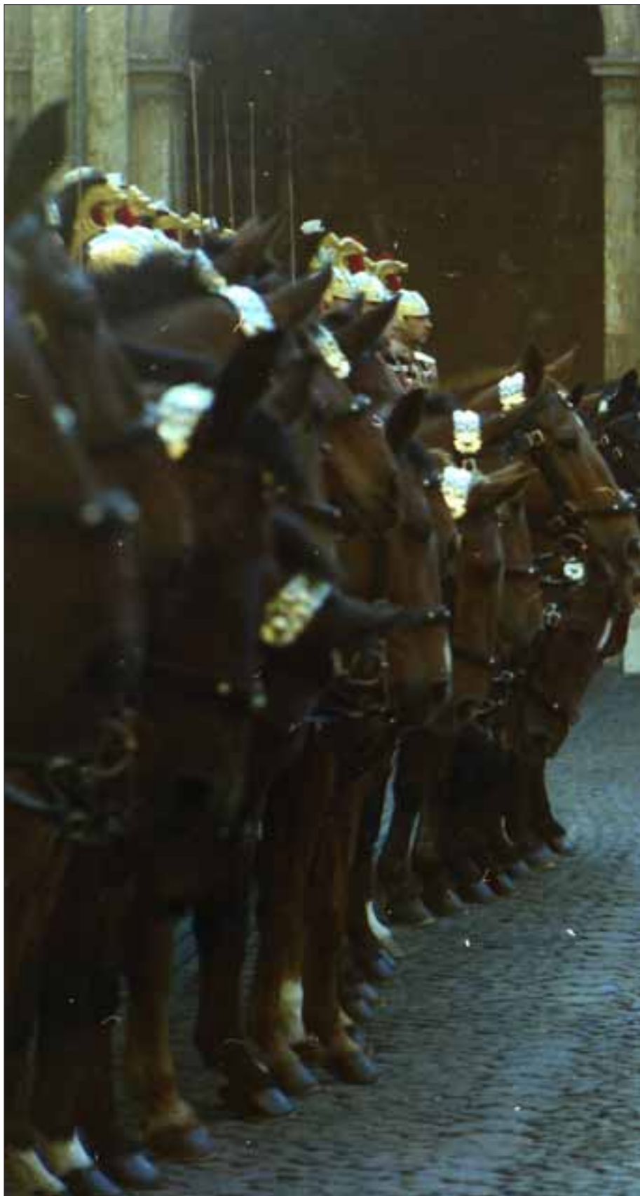
Palazzo del Quirinale, 8-10 novembre 1977. Visita di Stato di S.M. la Regina di Danimarca, Margrethe II, e di S.A.R. il Principe Consorte Henrik.