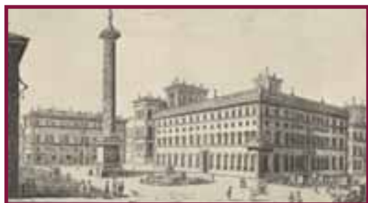
Roma. Palazzo Chigi – Piazza Colonna (Roma 1922-1959), sede del Ministero degli Affari Esteri.