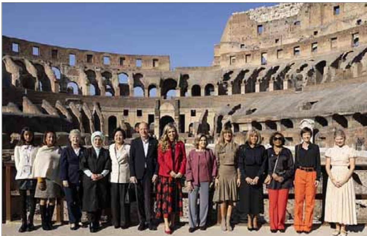
Le First Ladies del G.20 al Colosseo.