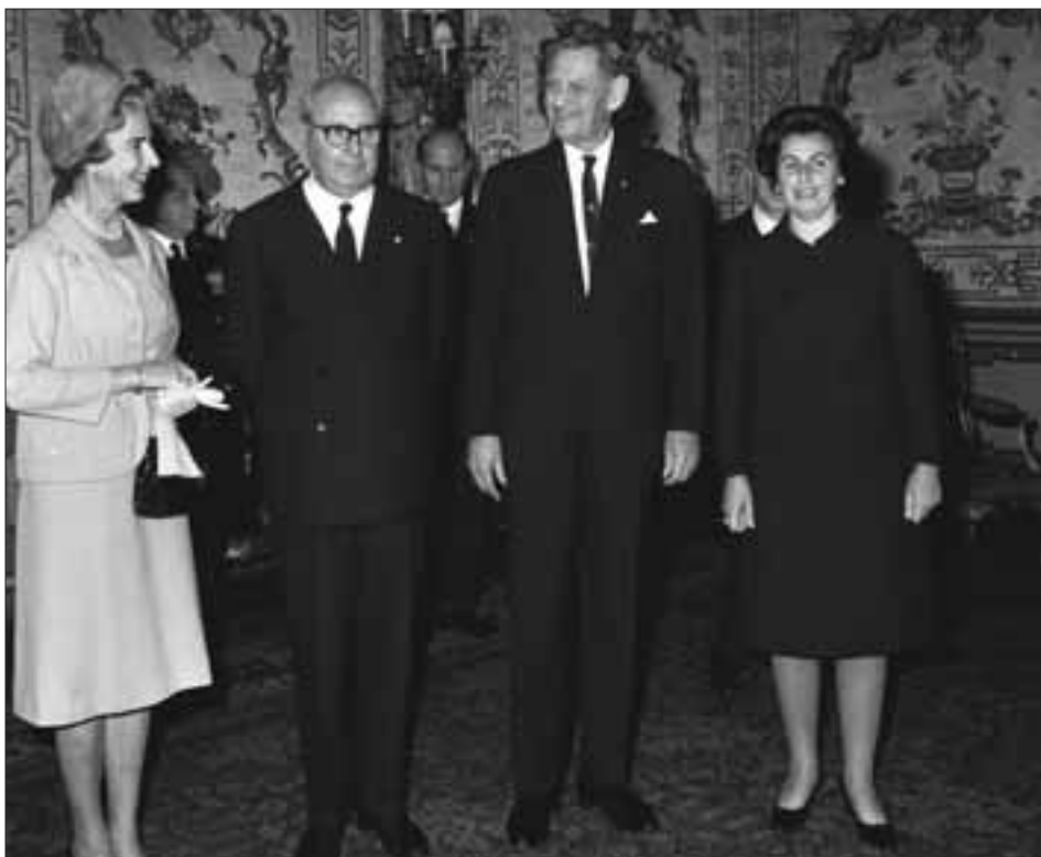
Palazzo del Quirinale, 20 ottobre 1965. Visita di S.M. il Re di Danimarca, Frederik IX, e della Regina Ingrid.