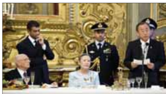
Palazzo del Quirinale, 2 giugno 2011. Il Presidente Giorgio Napolitano ascolta il saluto del Segretario Generale delle Nazioni Unite Ban Ki Moon.