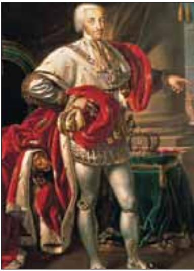
Re Vittorio Emanuele I. L. Bernero. Museo Nazionale del Risorgimento Italiano. Torino.