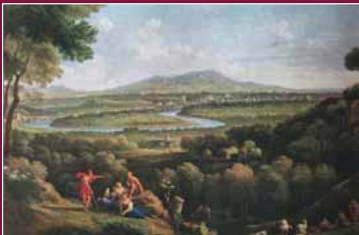
Jan Frans Van Bloemen (Amsterdam 1662 - Roma 1749). Veduta panoramica dell'ansa del Tevere sotto Monte Mario. Si riconosce a destra l'edificio di Villa Madama.