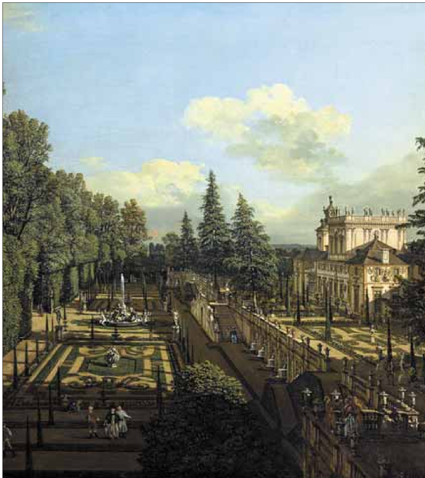
Reggia La Venaria Reale, Giardini.