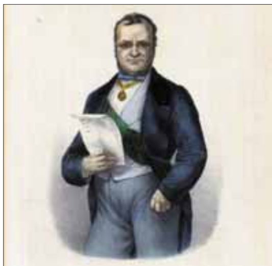
Camillo Benso di Cavour.