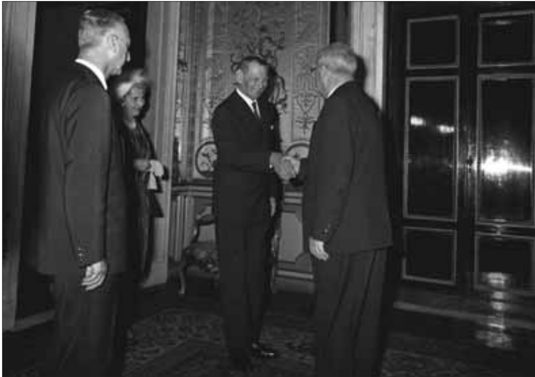
Palazzo del Quirinale, 20 ottobre 1965. Visita di S.M. il Re di Danimarca, Frederik IX, e della Regina Ingrid.