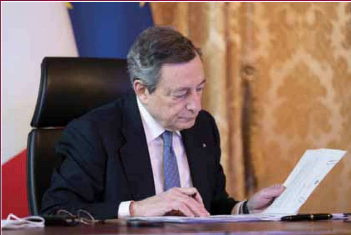
Il Presidente del Consiglio dei Ministri Mario Draghi.