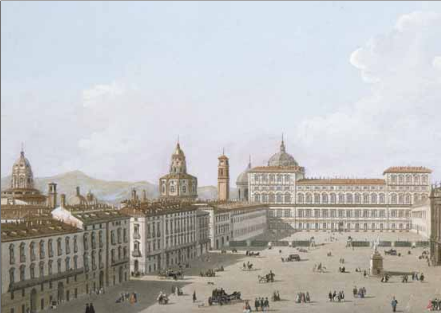
Torino. Veduta di Piazza Castello, incisione in rame di Francesco Citterio su disegno di Carlo Bossoli, 1855 circa.