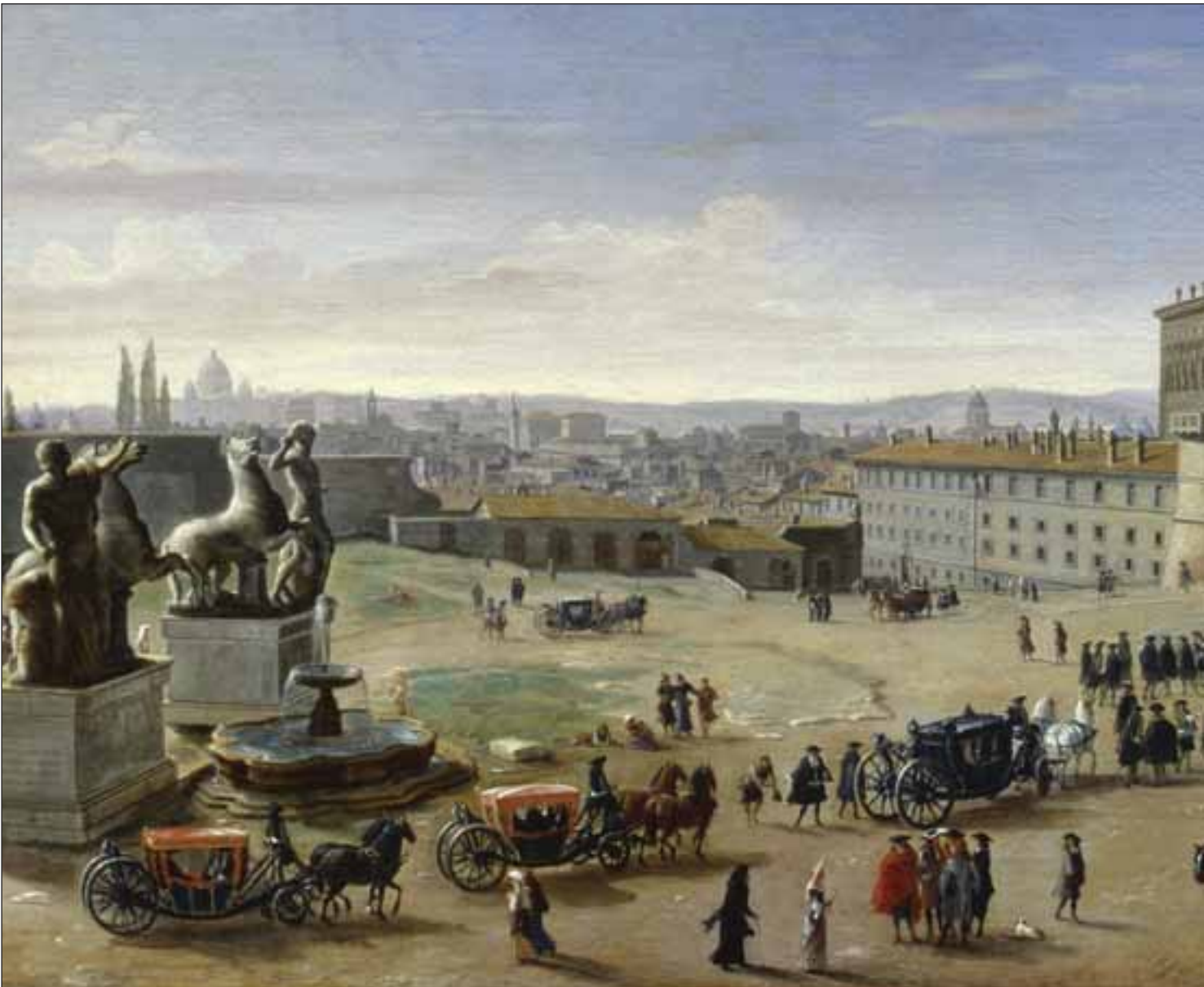
Roma. Veduta della Piazza e del Palazzo di Monte Cavallo, Gaspar van Wittel. La Spezia, Museo Civico Amedeo Lia.