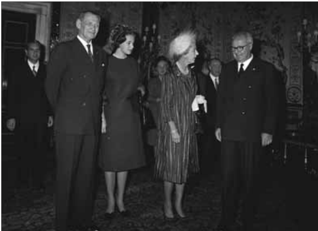
Palazzo del Quirinale, 20 ottobre 1965. Visita di S.M. il Re di Danimarca, Frederik IX, e della Regina Ingrid.