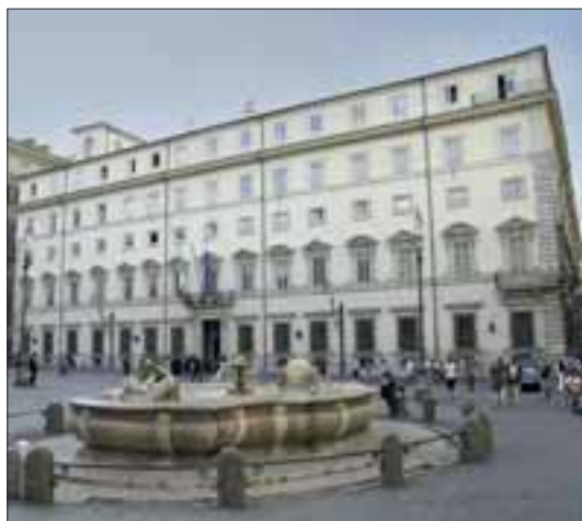
Roma, Palazzo Chigi. Presidenza del Consiglio dei Ministri.