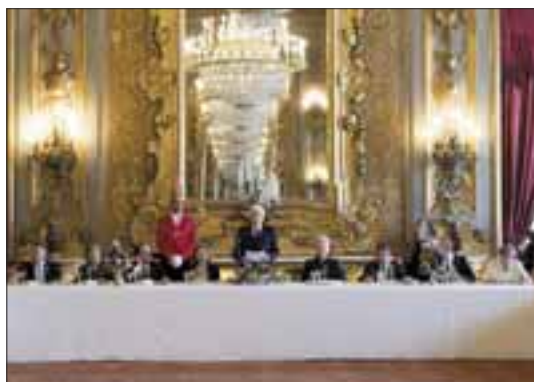
Quirinale, 25 marzo 2017. Il Presidente Sergio Mattarella in occasione della colazione in onore dei Capi di Stato e di Governo dell'Unione Europea e dei Vertici delle Istituzioni Europee per il 60° anniversario dei Trattati di Roma.