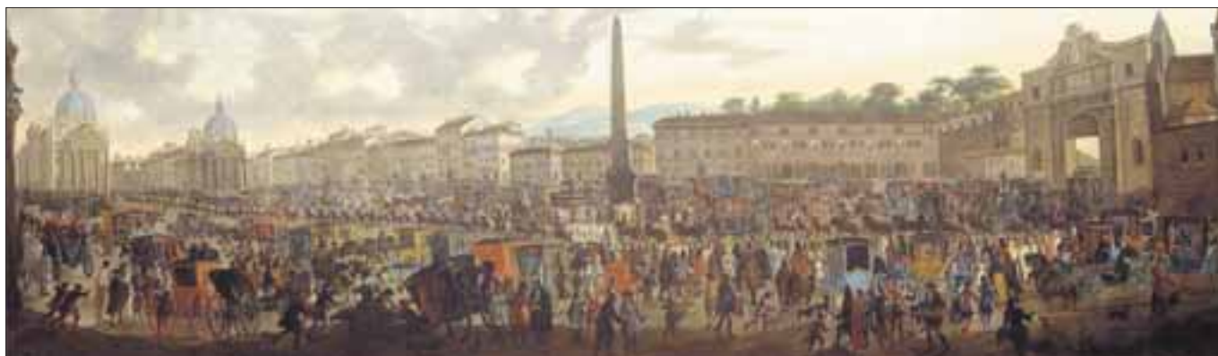
Autore ignoto, Ingresso a Roma, da Porta del Popolo, dell'Ambasciatore veneto Nicola Duodo, 1714, olio su tela, inv. MR 1443. Roma, Museo di Roma