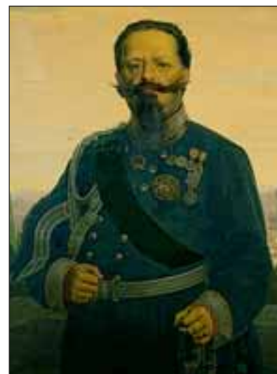
Re Vittorio Emanuele II. Ambasciata d'Italia a Bruxelles.