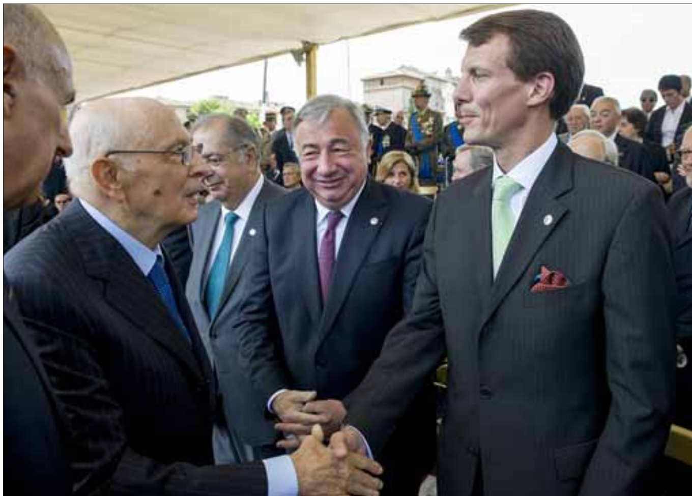
Roma, 2 giugno 2011. Il Presidente della Repubblica Giorgio Napolitano incontra il Principe di Danimarca Joachim Holger Waldemar Christian, Conte di Monpezat in occasione delle celebrazioni del 150° anniversario dell'Unità d'Italia.