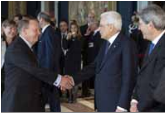
Il Presidente della Repubblica Sergio Mattarella saluta il Primo Ministro del Regno di Danimarca Lars Lokke Rasmussen.