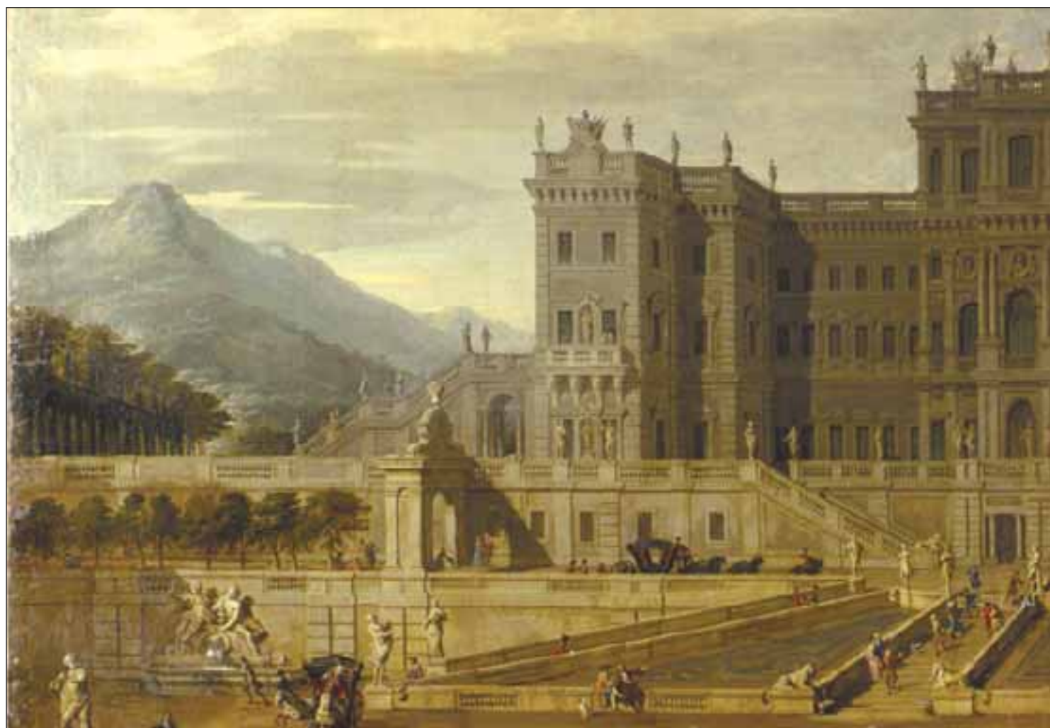
Racconigi. Gian Paolo Pannini, Veduta del Castello di Rivoli verso Mezzogiorno, c.1724*.