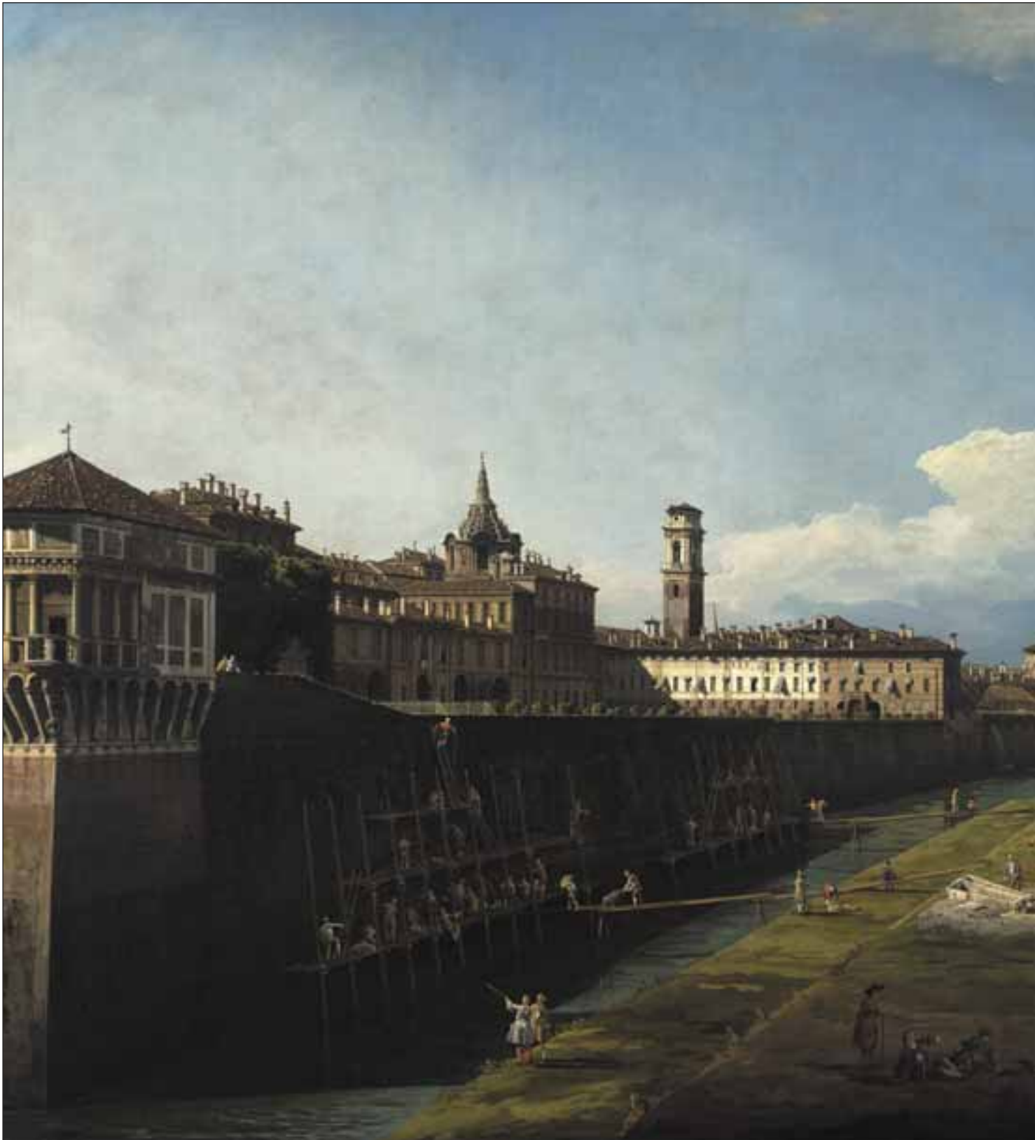
Palazzo Reale da fuori le mura cittadine. Dipinto di Bernardo Bellotto, 1745.