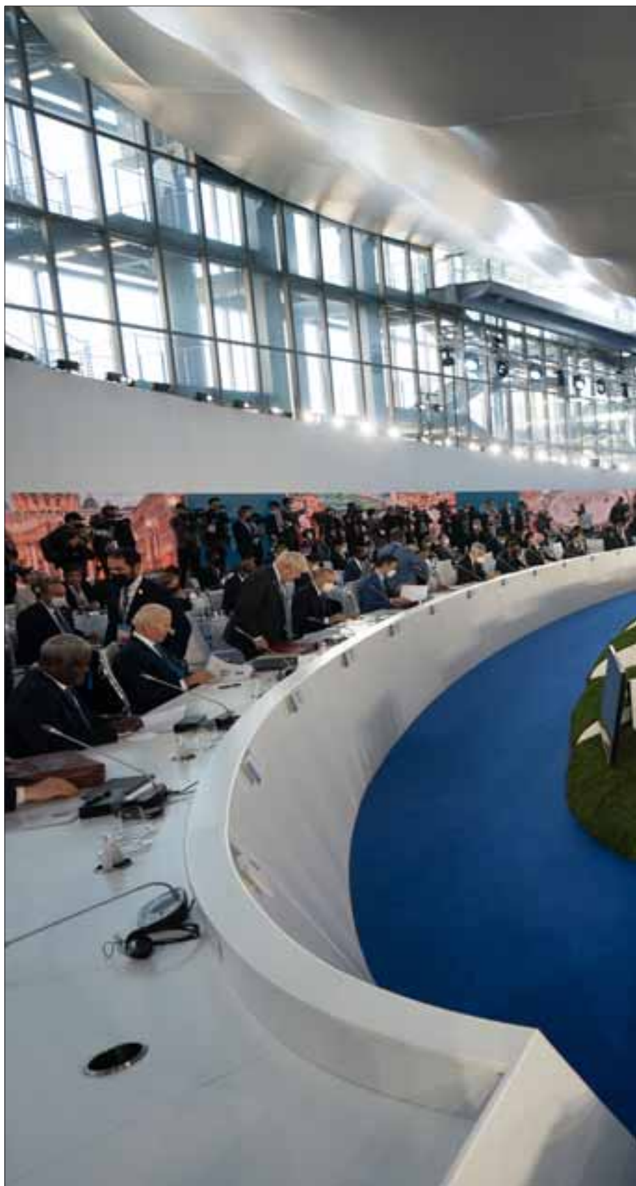
Roma, 30 ottobre 2021. Il giro di tavolo della prima sessione di lavoro del G20 Rome Summit su “Global Economy and Global Health”.