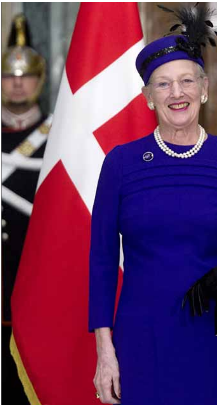
Palazzo del Quirinale, 27 ottobre 2017. Il Presidente della Repubblica Sergio Mattarella e S.M. la Regina di Danimarca Margrethe II.