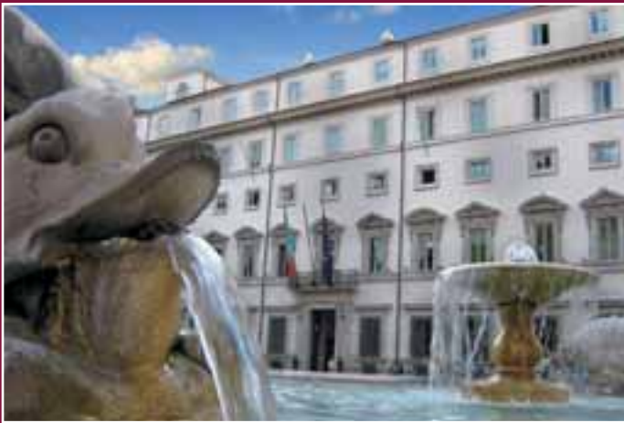
Roma. Palazzo Chigi, Sede del Governo.