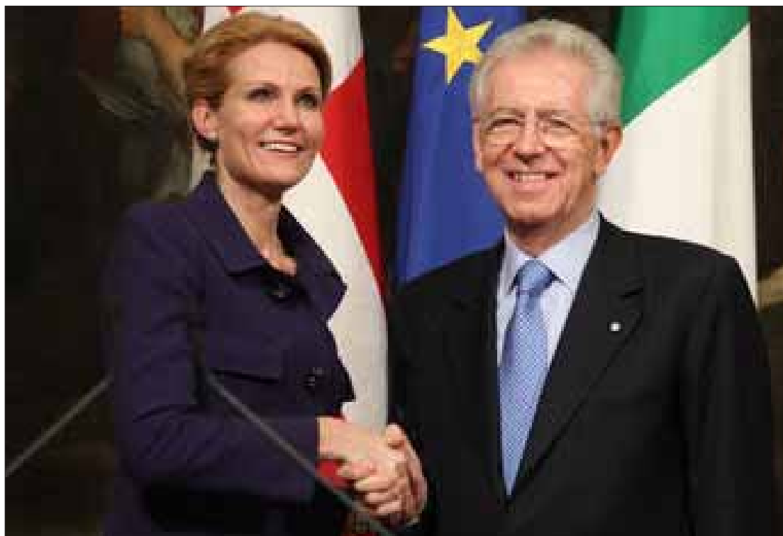
Roma, 12 dicembre 2011. Palazzo Chigi. Il Presidente del Consiglio Mario Monti incontra il Primo Ministro danese Helle Thorning Schmidt.