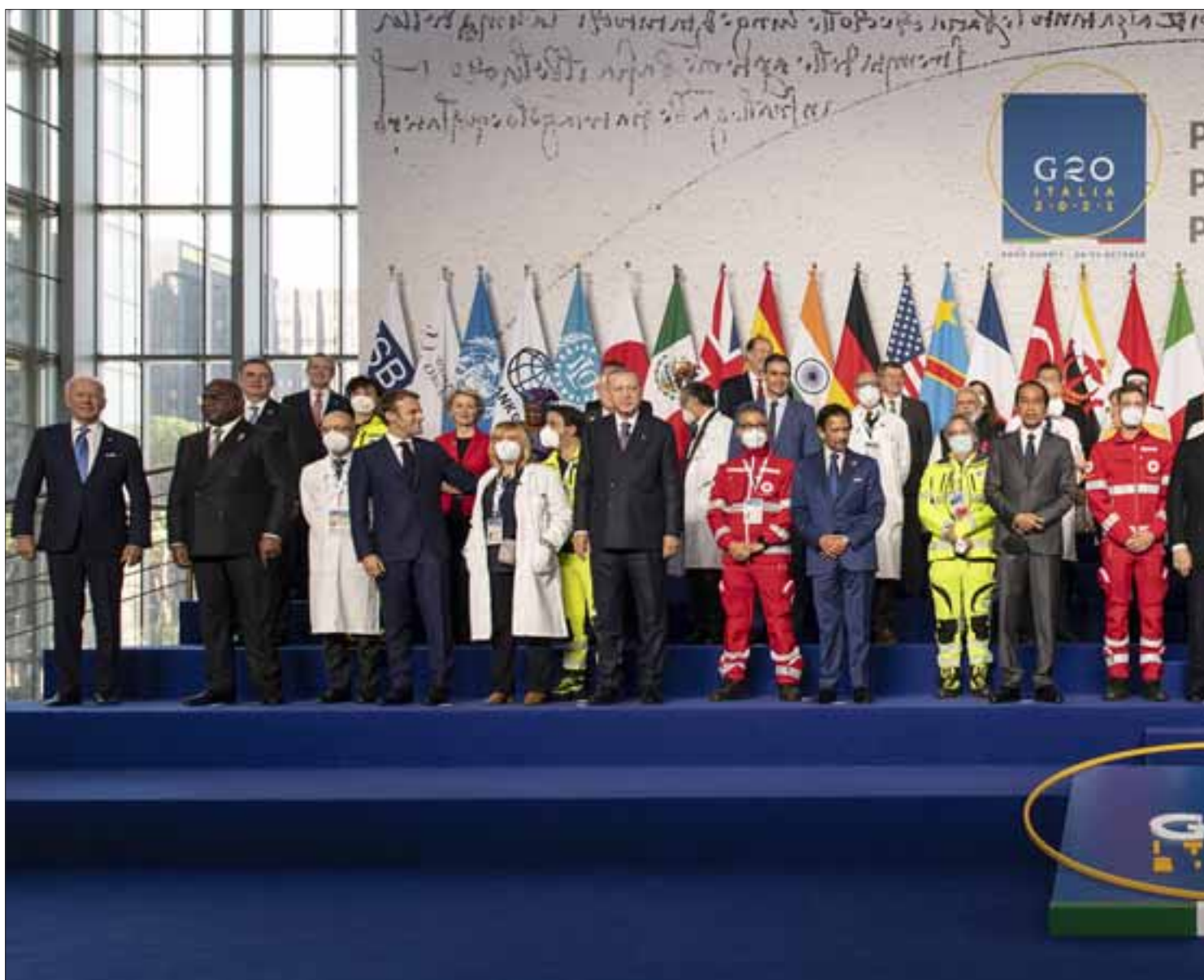
Roma, 30 ottobre 2021. La foto di famiglia dei Leader insieme ad una delegazione di medici ed infermieri impegnati nel contrasto alla pandemia da Covid-19.