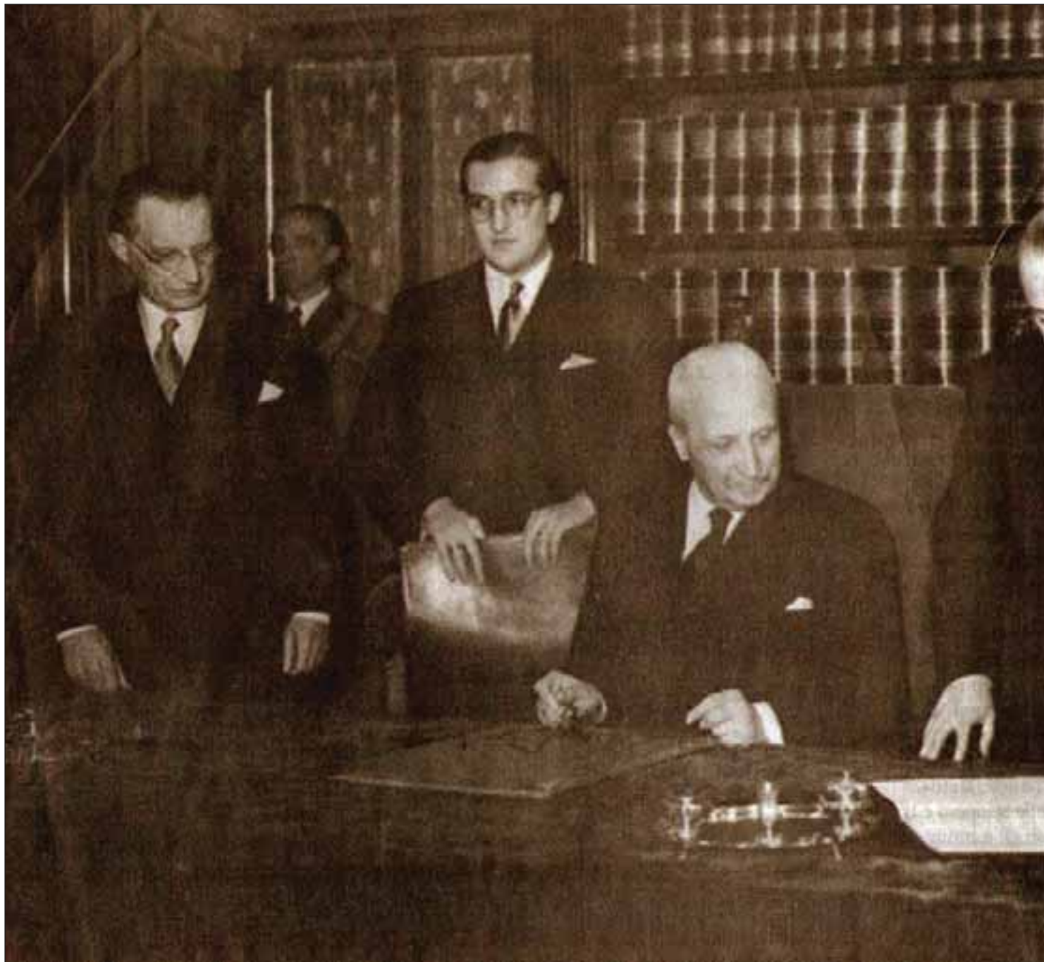
Roma. Palazzo Giustiniani, 27 dicembre 1947. La firma della Costituzione italiana: Alcide De Gasperi (a sinistra), Enrico De Nicola (seduto al centro) e Umberto Terracini (mentre firma).

Il Torrino è uno dei punti più elevati della capitale. Dai suoi saloni, dove a volte si tengono pranzi in occasione di visite di capi di Stato, si può ammirare un panorama a 360 gradi sulla città.