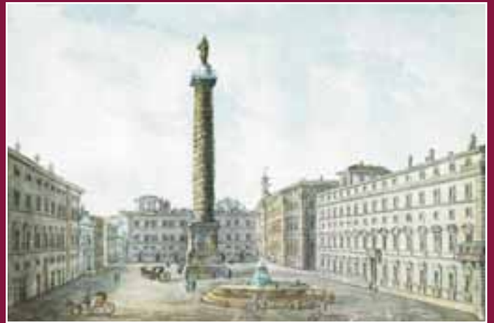
Veduta di Piazza Colonna. Anonimo del XVIII secolo.