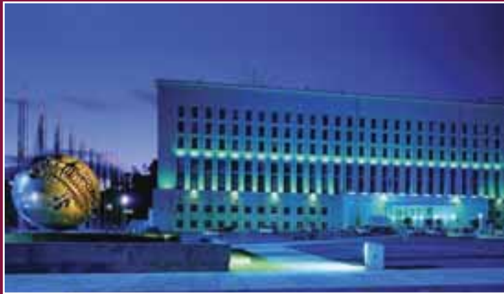
Roma. La Farnesina, Sede del Ministero degli Affari Esteri e della Cooperazione Internazionale.