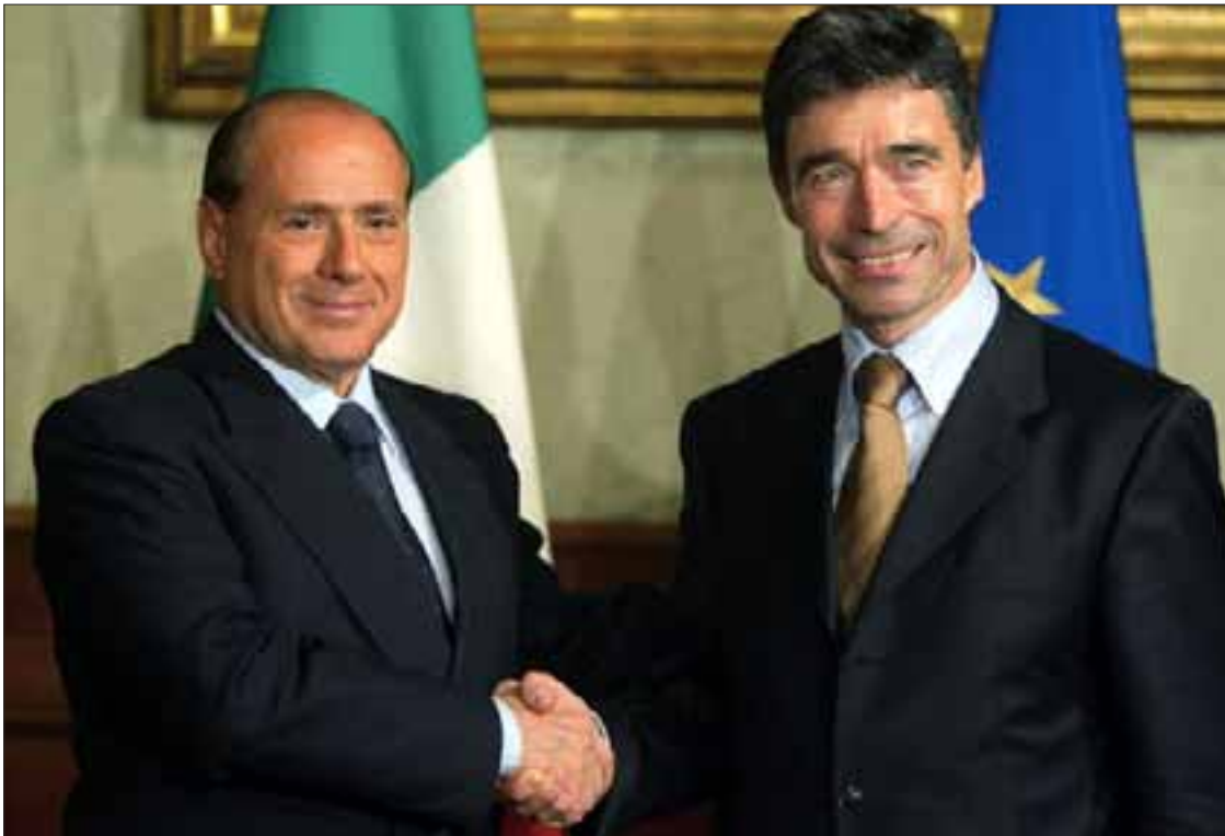
Roma, 3 dicembre 2002. Il Presidente del Consiglio Silvio Berlusconi con il Primo Ministro danese Anders Fogh Rasmussen nell'ambito del "giro delle capitali" di questi prima del Consiglio Europeo (Presidenza di turno danese del Consiglio dell'Unione Europea).