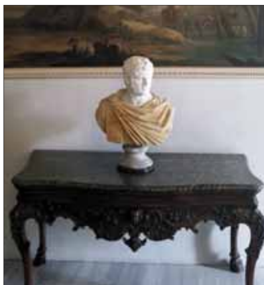
Villa Madama. Ingresso. Particolare.