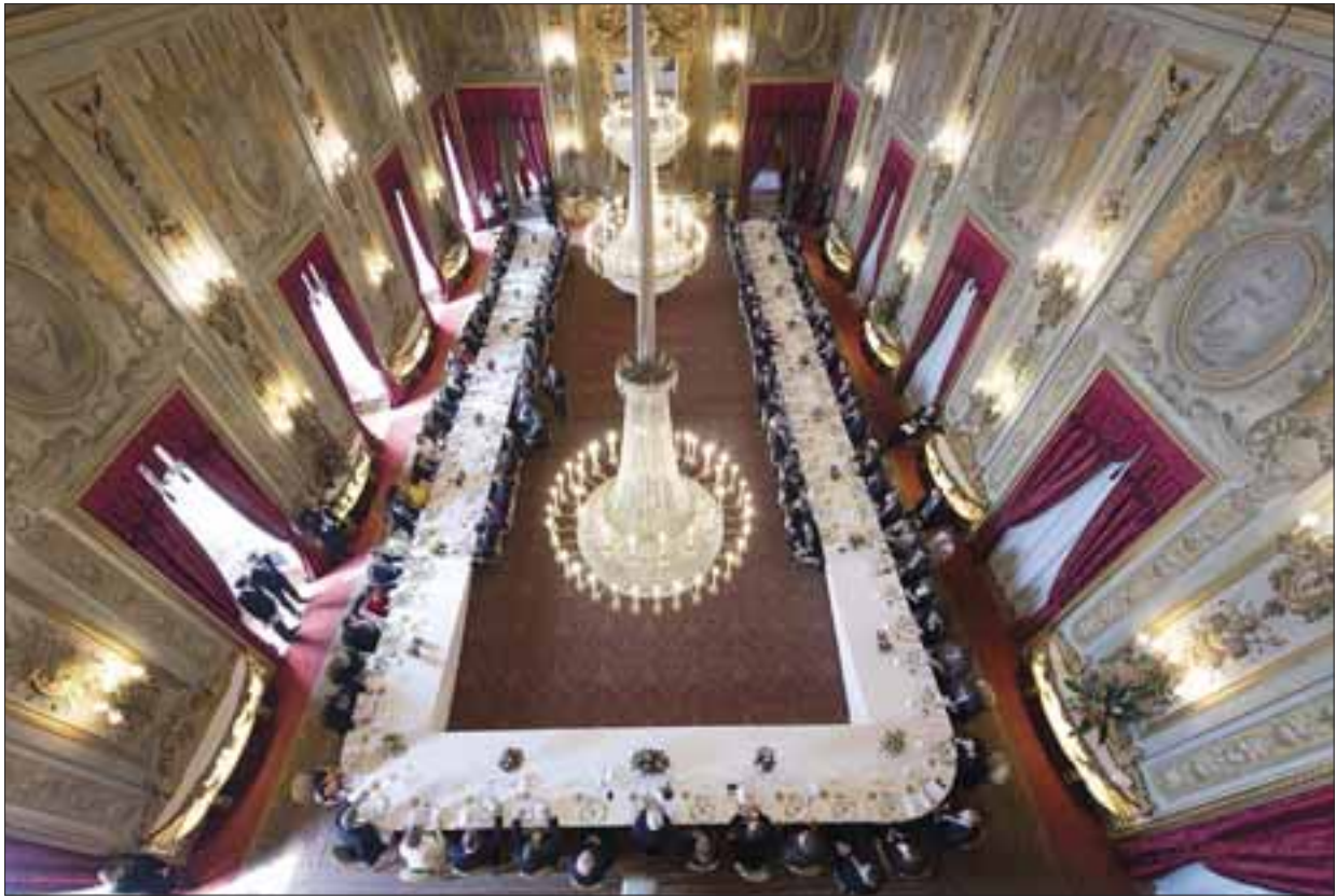
Palazzo del Quirinale, 25 marzo 2017. Brindisi in occasione della colazione con i Capi di Stato e di Governo della UE per il 60° anniversario dei Trattati di Roma.