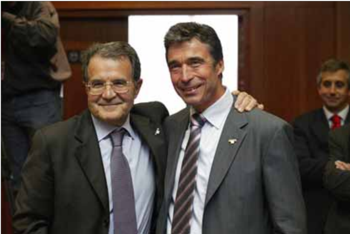
Roma, 13 ottobre 2006. Il Presidente del Consiglio Romano Prodi e il Primo Ministro danese Anders Fogh Rasmussen.