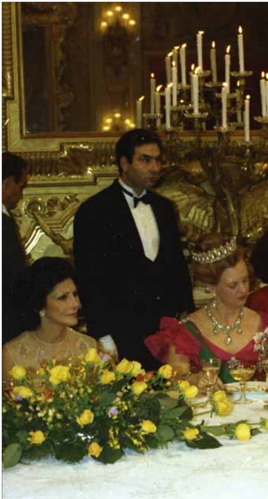
Palazzo del Quirinale, 8-10 novembre 1977. Visita di Stato di S.M. la Regina di Danimarca, Margrethe II, e di S.A.R. il Principe Consorte Henrik.