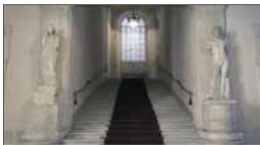
Palazzo Chigi. Lo Scalone d'Onore.