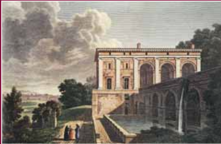
Roma. Villa Madama, Sede di Rappresentanza del Ministro degli Affari Esteri e della Cooperazione Internazionale.