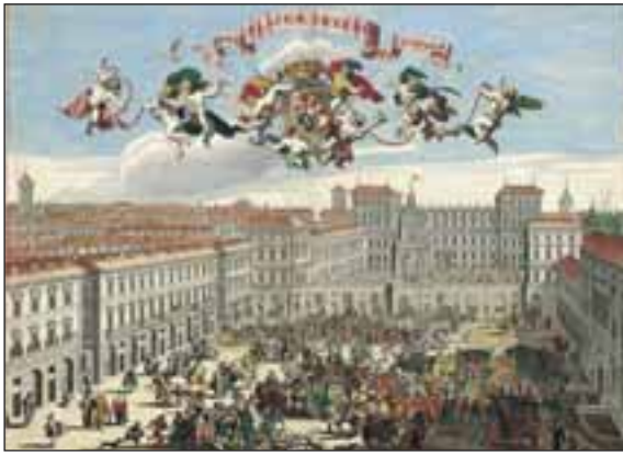
Veduta di Piazza Castello dal Theatrum Sabaudiae, I, tavola 11.

Composizione fotografica che riunisce in una sola immagine i Re d'Italia: Vittorio Emanuele II ed Umberto I, in alto a sinistra e a destra; Vittorio Emanuele III ed Umberto II, in basso a sinistra e a destra. Nel tondo piccolo in alto è il ritratto di Carlo Alberto di Sardegna.