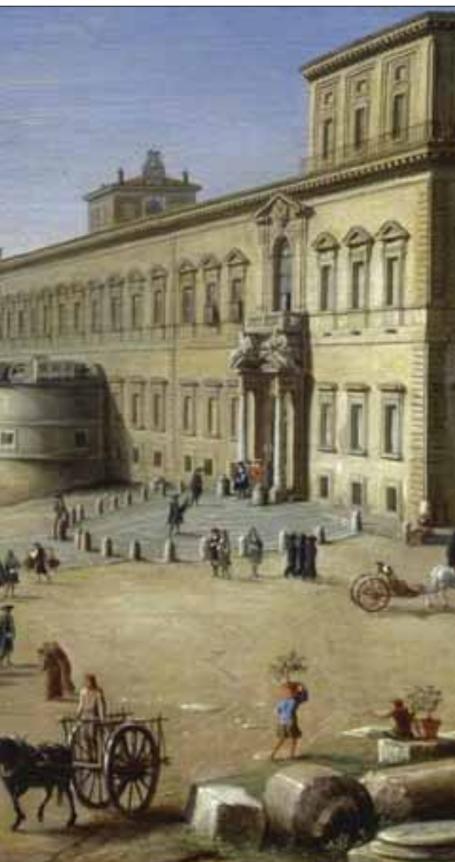
Disegno del Palazzo del Quirinale, di Francesco Corni.