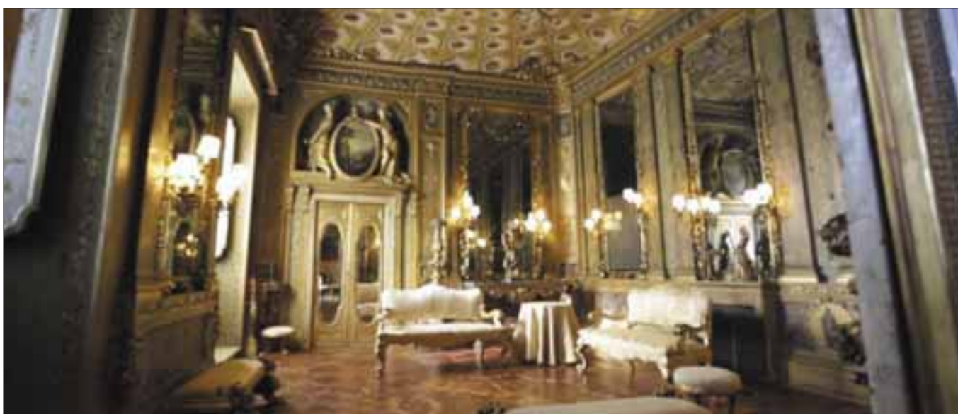
Palazzo Chigi. Il Salotto d'Oro.