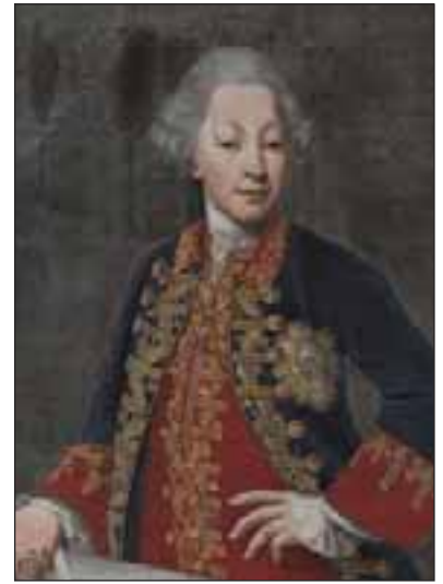
Re Carlo Emanuele IV di Savoia. Pittore piemontese (seconda metà del 1700). Collezione privata.