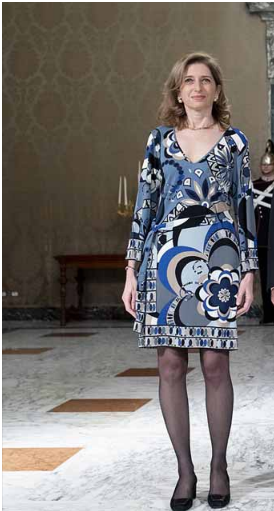
Palazzo del Quirinale, 6 novembre 2018. Il Presidente della Repubblica Sergio Mattarella e la Sig.ra Laura, con S.A.R. il Principe Frederik e S.A.R. la Principessa Mary di Danimarca.