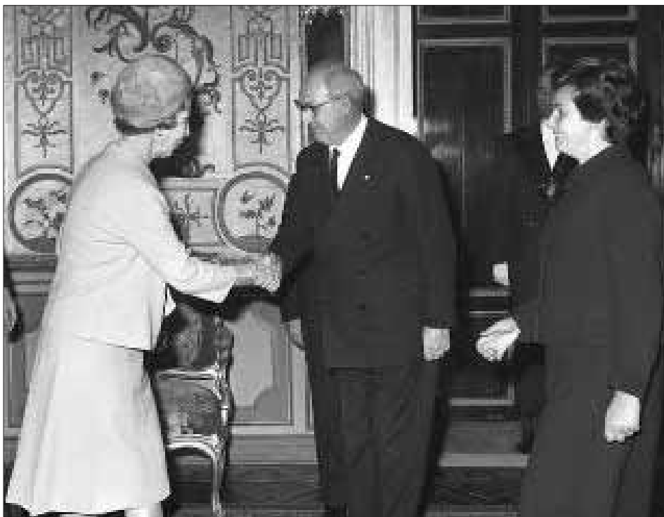
Palazzo del Quirinale, 20 ottobre 1965. Visita di S.M. il Re di Danimarca, Frederik IX, e della Regina Ingrid.