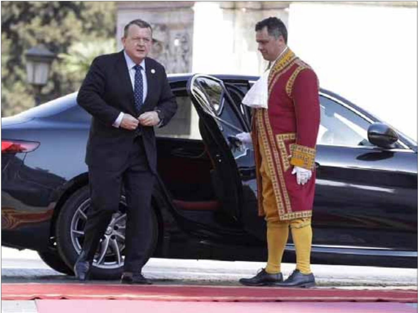
Roma, Campidoglio, 25 marzo 2017. Il Primo Ministro danese Lars Lokke Rasmussen al suo arrivo al Campidoglio.