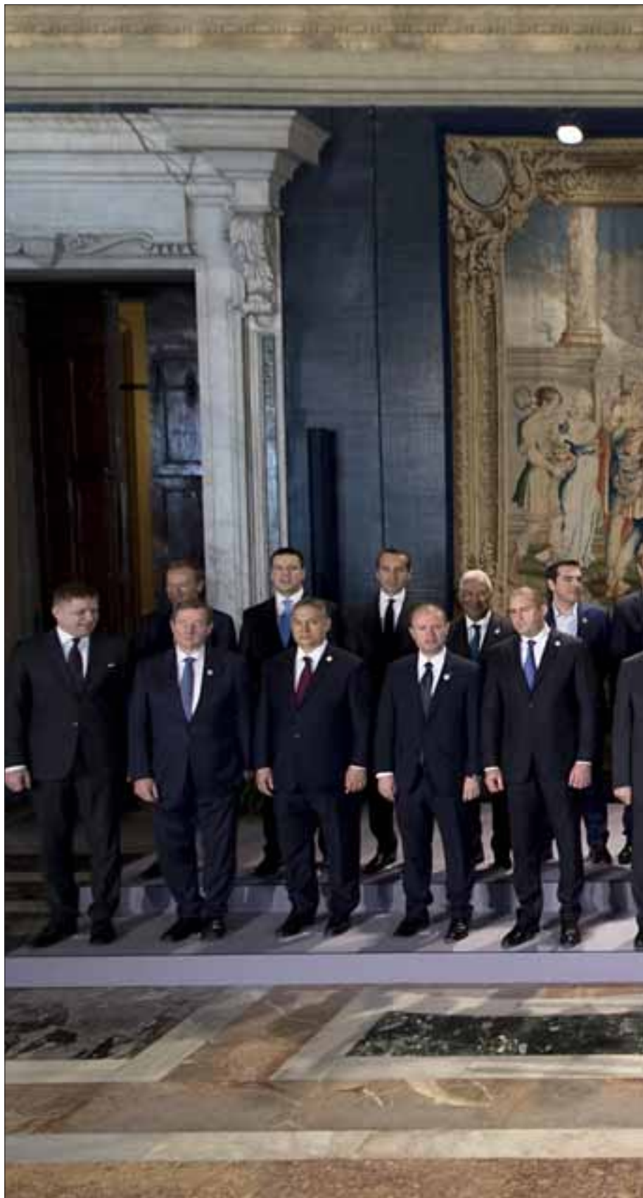
Quirinale 25 marzo 2017. Foto di Famiglia in occasione della celebrazione al Quirinale del 60° anniversario dei Trattati di Roma.