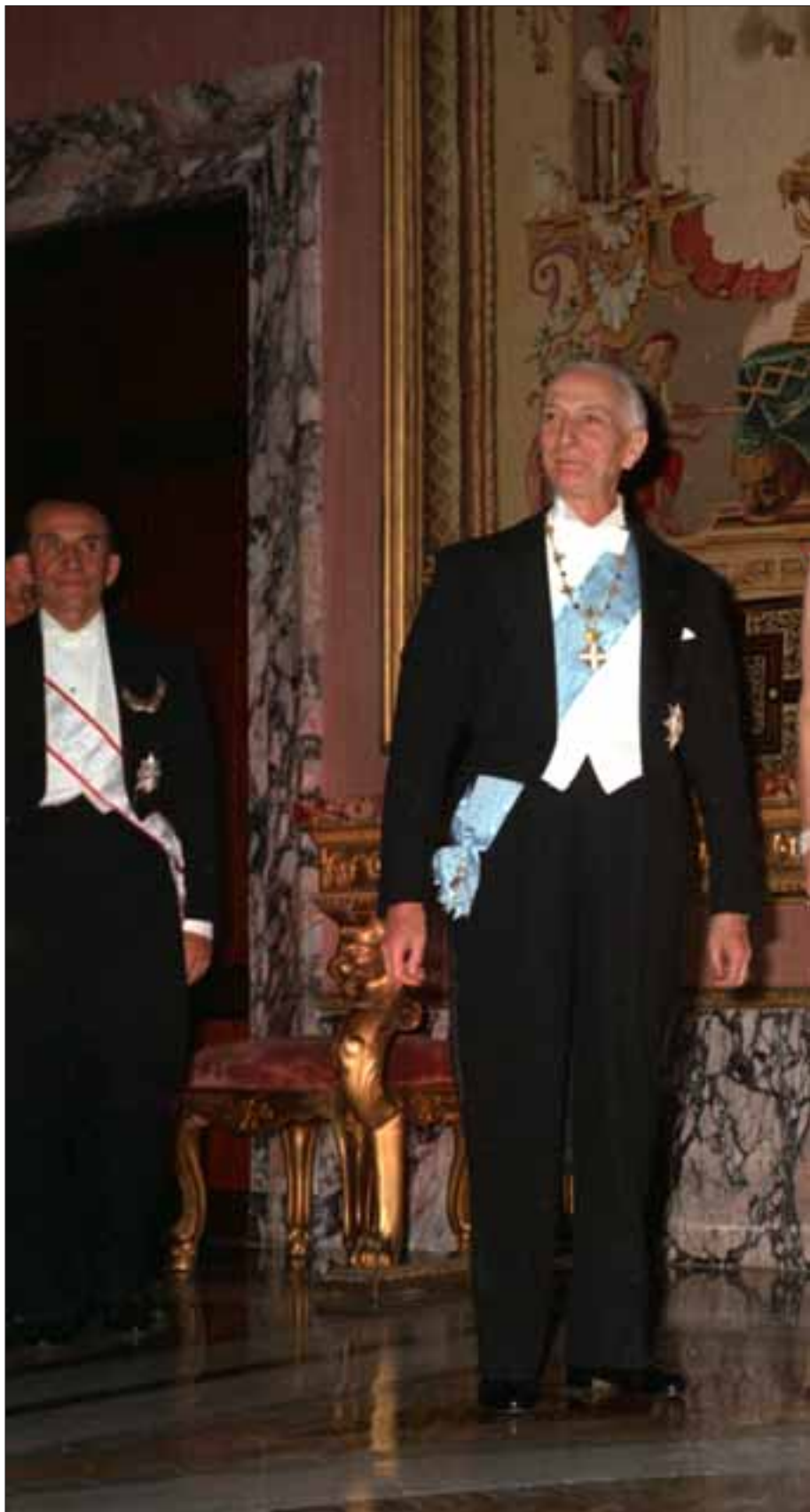
Palazzo del Quirinale, 20-22 aprile 1964. Visita di Stato di S.M. Il Re di Danimarca, Frederik IX, e della Regina Ingrid.