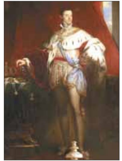
Re Carlo Alberto. F. Cavalleri. Castello Racconigi. Cuneo.*