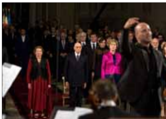
Palazzo del Quirinale, 2 giugno 2011. Il Presidente della Repubblica Giorgio Napolitano in occasione del concerto al Quirinale per la Festa della Repubblica, alla presenza dei Capi Delegazioni Ufficiali convenuti a Roma per le celebrazioni del 150° anniversario dell'Unità d'Italia.