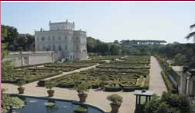
Roma. Villa Doria Pamphilj, Sede di Rappresentanza.