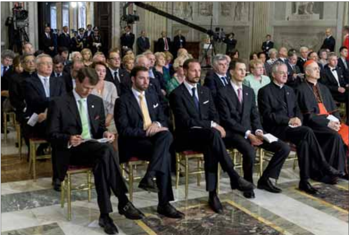
Palazzo del Quirinale, 2 giugno 2011. Il Presidente della Repubblica Giorgio Napolitano in occasione del concerto al Quirinale per la Festa della Repubblica, alla presenza dei Capi Delegazioni Ufficiali convenuti a Roma per le celebrazioni del 150° anniversario dell'Unità d'Italia.