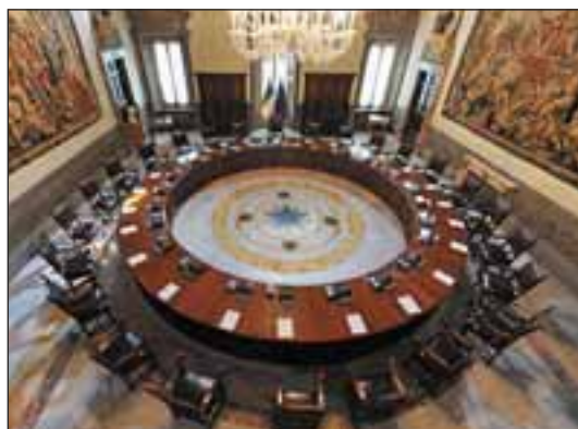
Palazzo Chigi. La Sala del Consiglio dei Ministri.