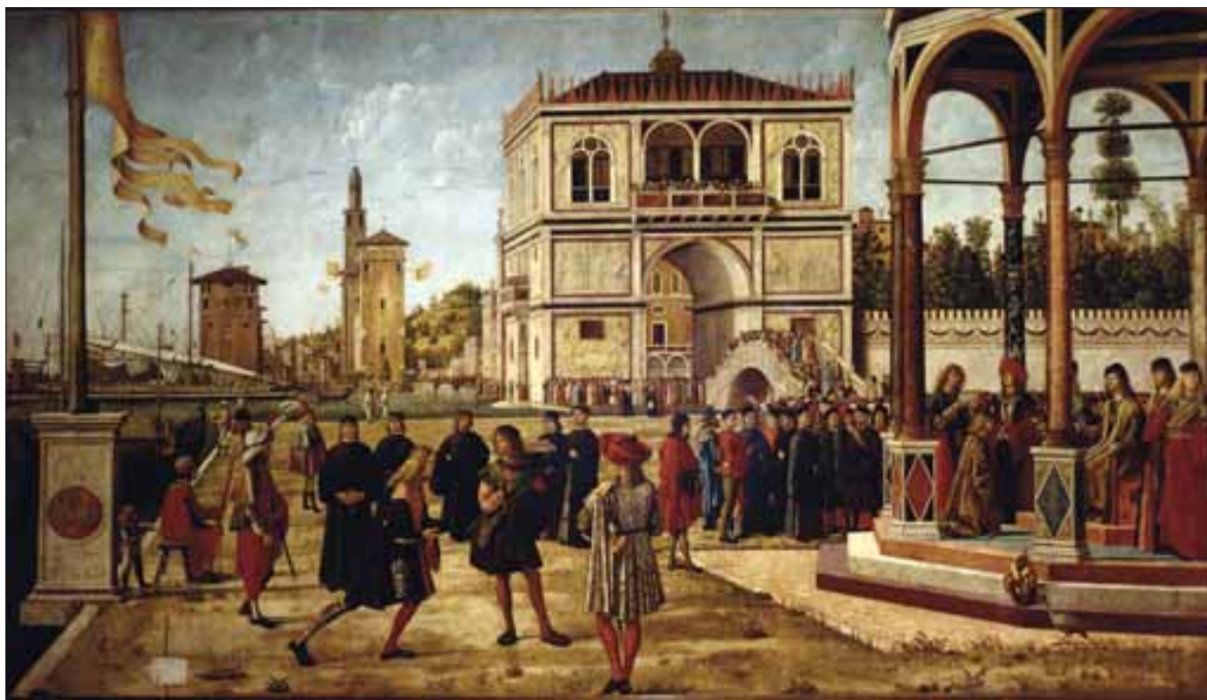
Vittore Carpaccio (Venezia 1465 ca. - 1526). Ritorno degli Ambasciatori. Dipinto eseguito per la scuola di Sant'Orsola di Venezia. Gallerie dell'Accademia di Venezia.