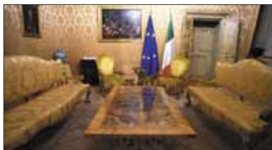
Palazzo Chigi. Il Salotto Giallo.