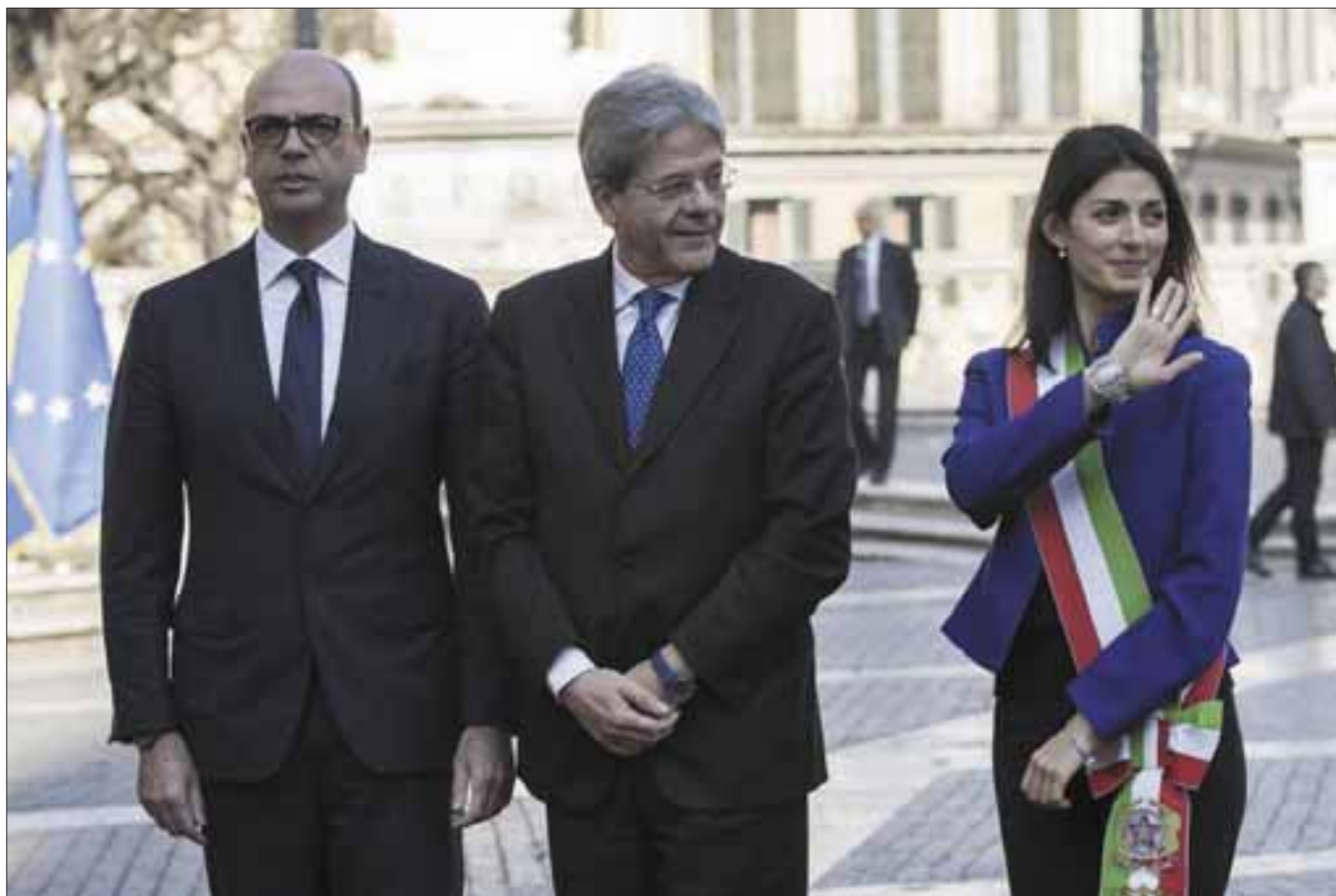
Roma, Campidoglio, 25 marzo 2017. Il Presidente del Consiglio Paolo Gentiloni, il Ministro degli Affari Esteri Angelino Alfano ed il Sindaco di Roma Virginia Raggi in attesa di accogliere il Primo Ministro danese Lars Lokke Rasmussen.