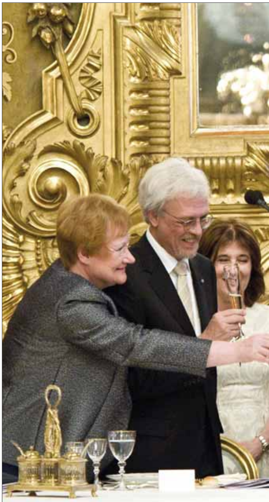
Palazzo del Quirinale, 2 giugno 2011. Il Presidente Giorgio Napolitano durante il brindisi con i Capi Delegazioni Ufficiali convenuti a Roma per le celebrazioni del 150° anniversario dell'Unità d'Italia.