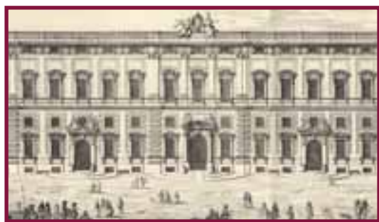
Roma. Palazzo della Consulta – Piazza del Quirinale. (Roma 1871-1922), sede del Ministero degli Affari Esteri.