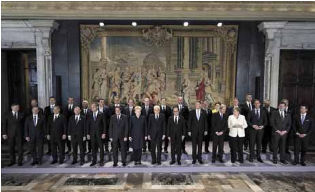
Palazzo del Quirinale, 25 marzo 2017. Foto di Famiglia.