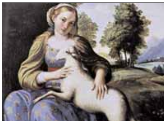
Roma, Palazzo Chigi. S. Agnese di Dominichino.