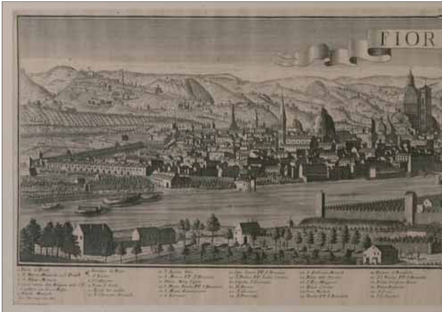
Bernard Friederich Werner, 1705. Veduta di Firenze. Gabinetto Disegni e Stampe, Galleria degli Uffizi, Firenze. Ministero della Cultura, Roma.