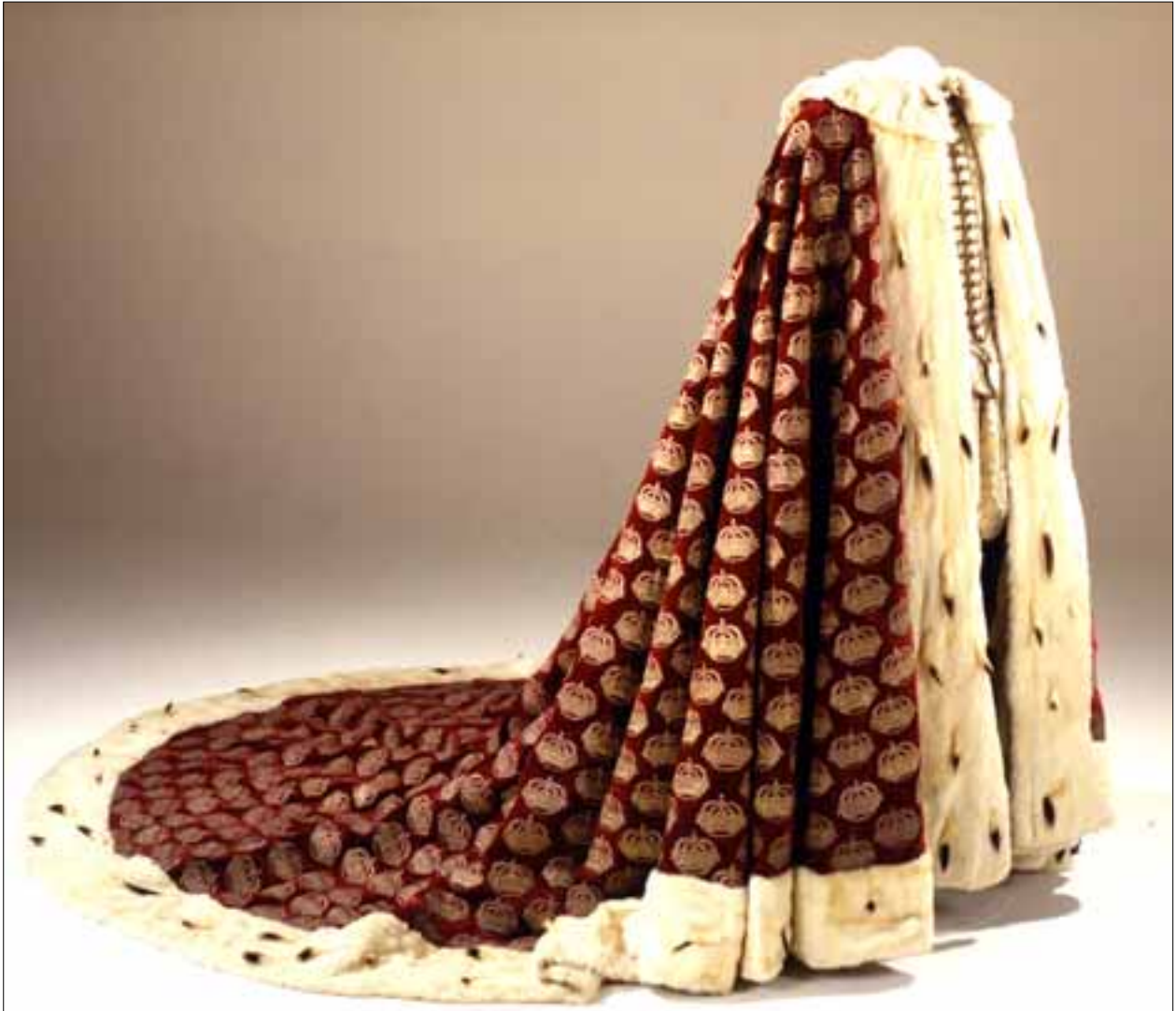
Manto di consacrazione di Christian V, 7 giugno 1671. Kongernes Samling, Rosenborg