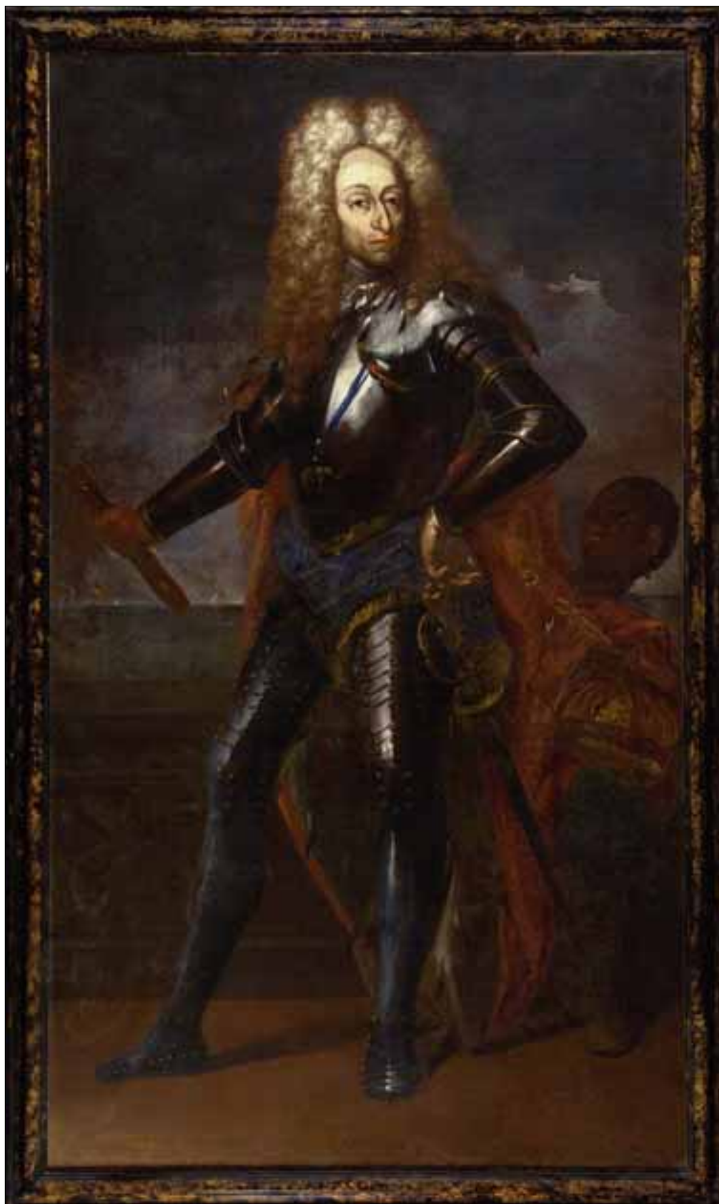
Pier Dandini, Ritratto di Frederik IV , 1709, Galleria Palatina, Firenze. Ministero della Cultura, Roma.