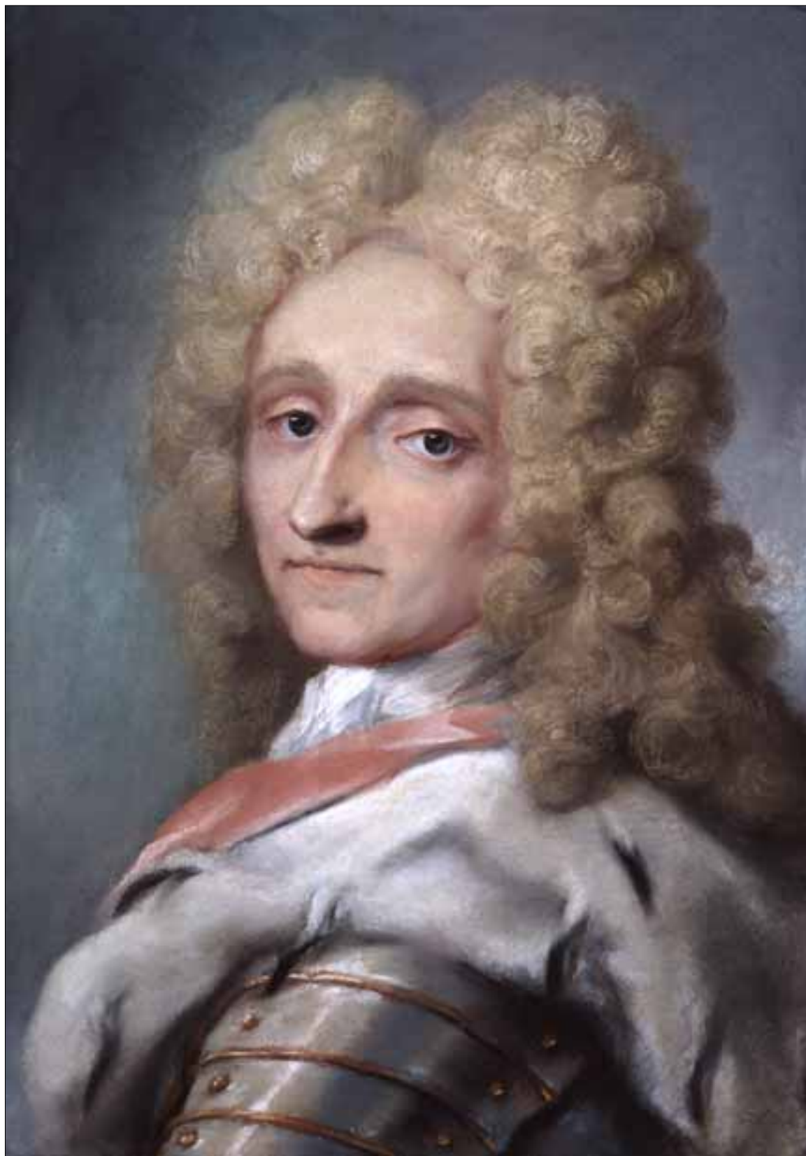
Hyacinthe Rigaud, Frederik IV , c. 1710. Museum of National History, Frederiksborg Castle.