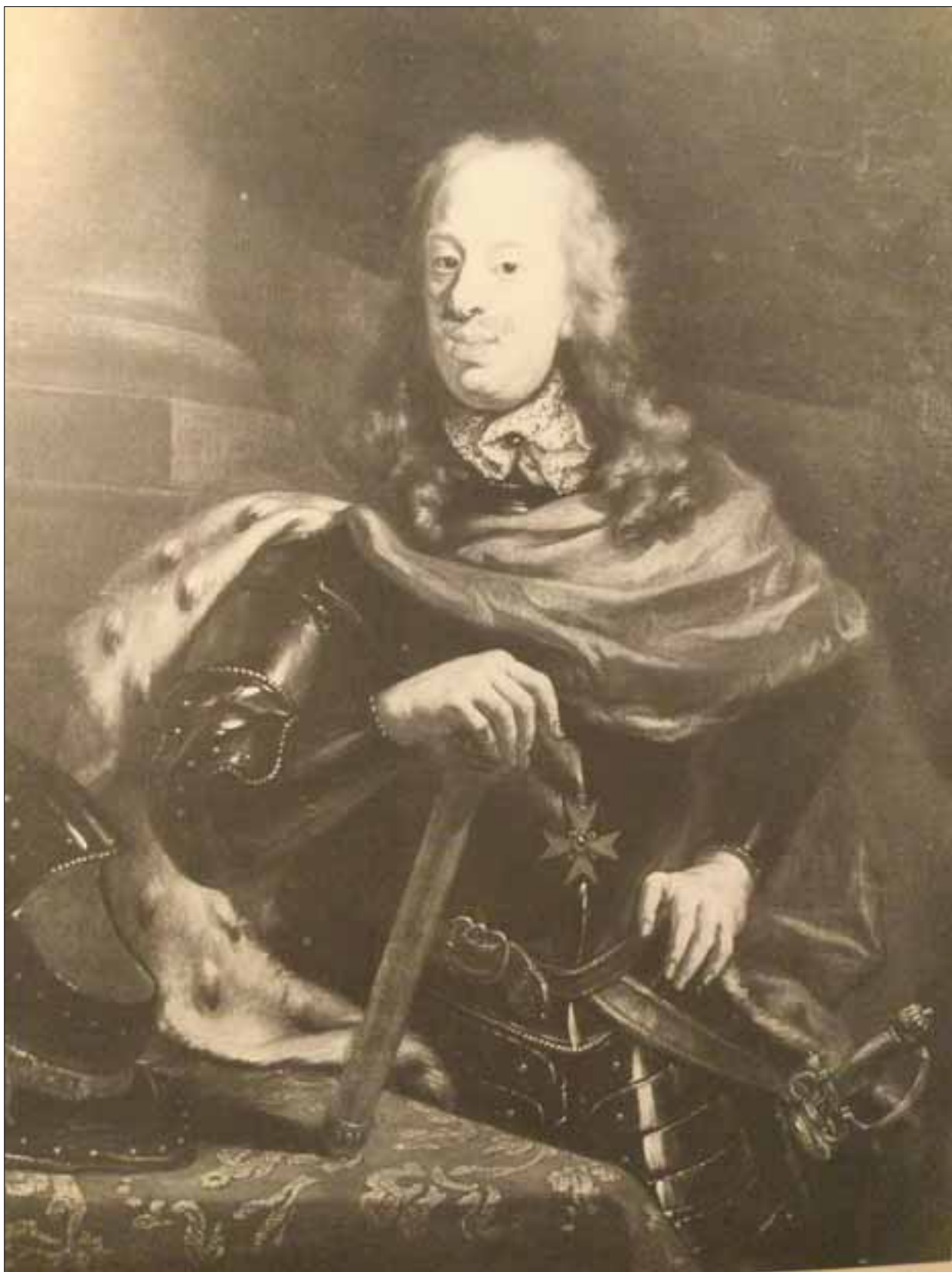
Anonimo, Il Granduca Cosimo III de' Medici , 1709. Museo Nazionale di San Matteo. Pisa. Ministero della Cultura. Roma.