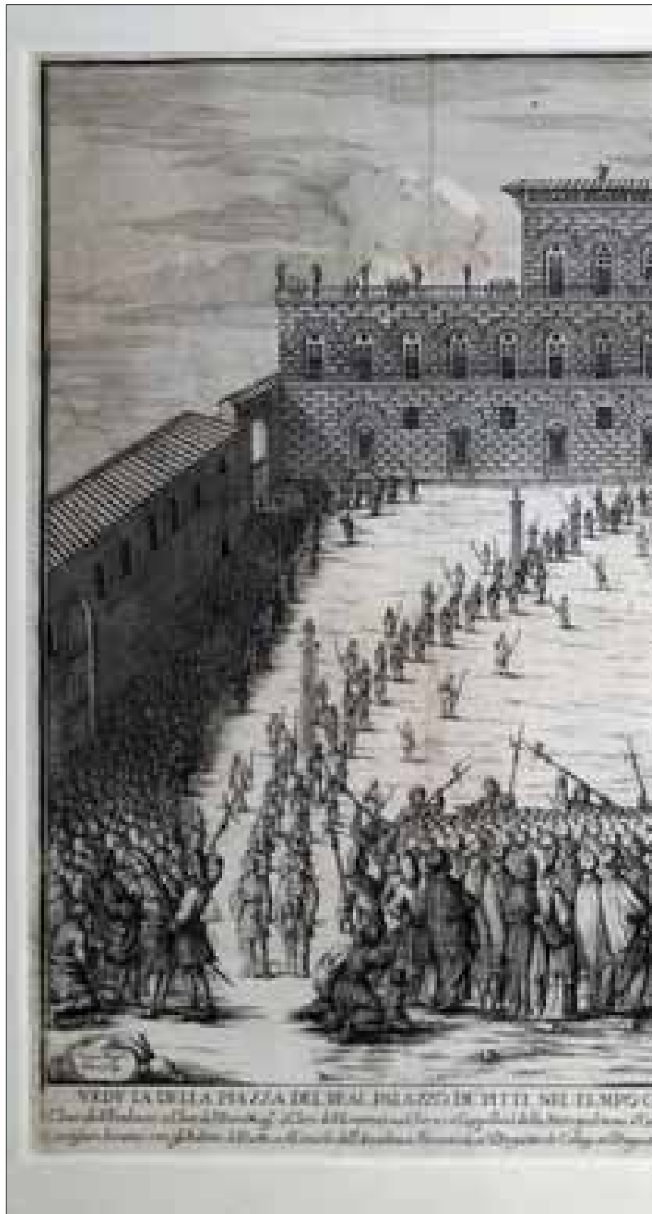
C. Magalli, 1711. Veduta di Palazzo Pitti nel tempo che viene posta la miracolosa immagine di Maria Vergine dell'Impruneta il di XXI di maggio MDCCXI. Gabinetto Disegni e Stampe, Galleria degli Uffizi, Firenze. Ministero della Cultura.Roma.