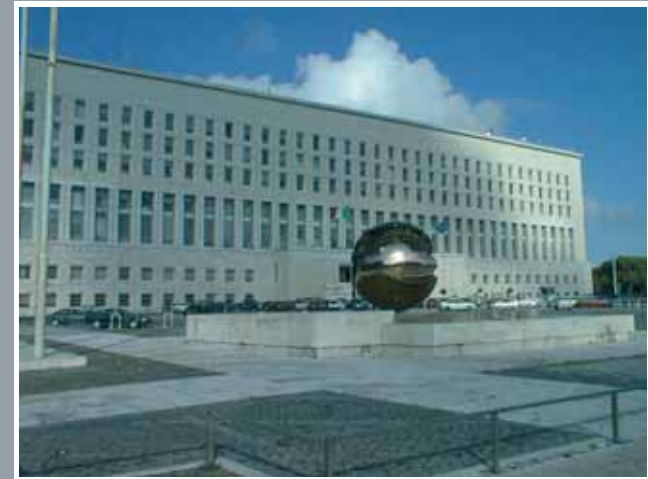
Palazzo della Farnesina, facciata principale.