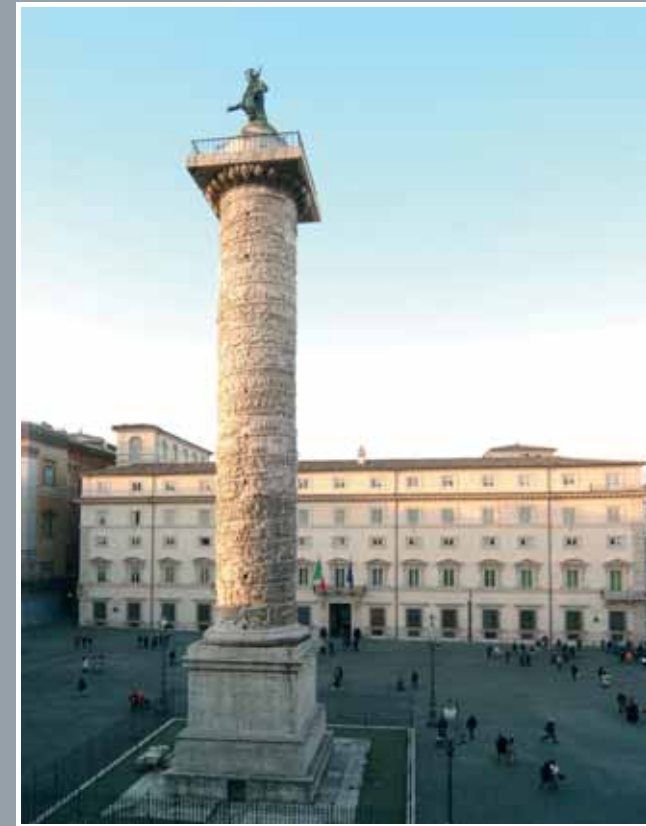
Palazzo Chigi, veduta della manica su Piazza Colonna.