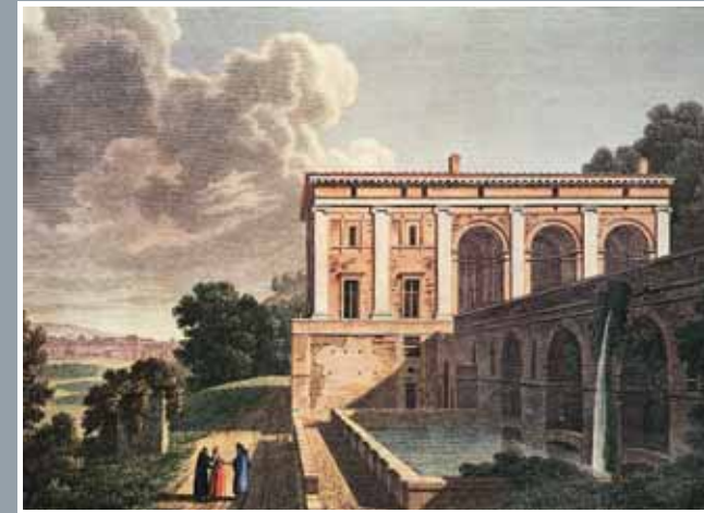
Veduta di Villa Madama dalla peschiera , acquaforte di Percier e Fontaine, primi dell'Ottocento. Immagine di repertorio.