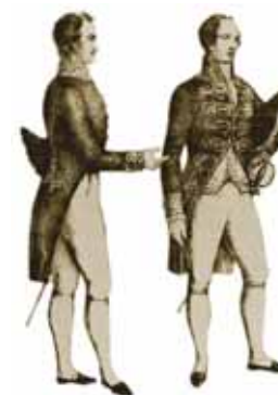
Ambasciatore Paolo Pucci di Benisichi Segretario Generale degli Esteri

Credo dunque che queste pagine potranno aiutare il lettore a scoprire, attraverso la descrizione di ricchezze artistiche e di circostanze storiche, anche lo spirito che da sempre anima le donne e gli uomini del Ministero degli Esteri.