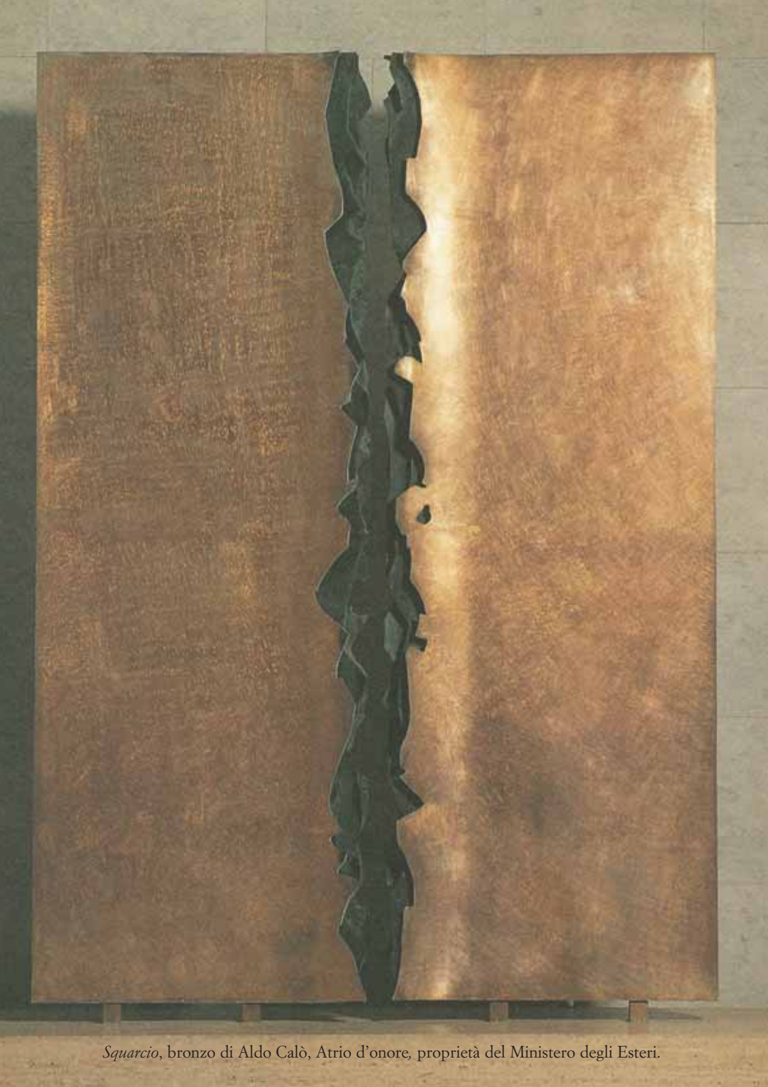
Squarcio , bronzo di Aldo Calò, Atrio d'onore, proprietà del Ministero degli Esteri.