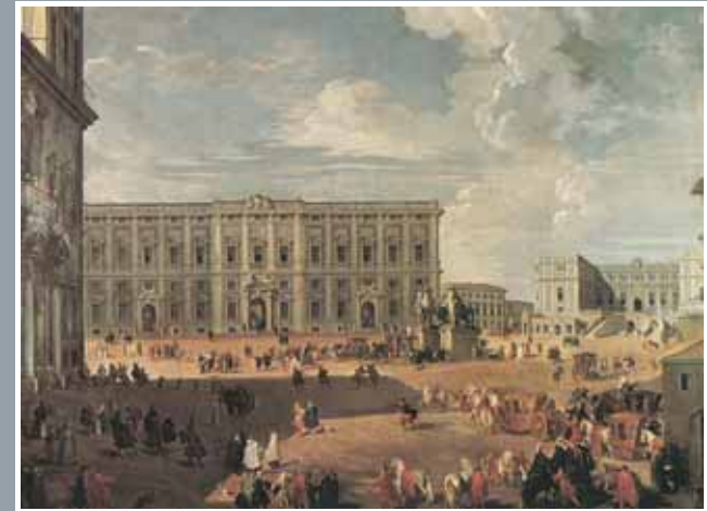
Veduta della Piazza del Quirinale con sullo sfondo il Palazzo della Consulta, Giovanni Paolo Pannini, per gentile concessione della Coffee House del Quirinale, Roma.

Roma: atto primo, ovvero la maturazione e consolidamento della “politica della Consulta” , espressione che diventerà, nel corso di oltre un cinquantennio, il simbolo di un atteggiamento diplomatico di misura, discrezione e responsabilità. Dopo aver riportato alla memoria lo strappo brusco, per gran parte della popolazione romana, degli avvenimenti del 1870, ci si sofferma sul nuovo salto qualitativo nella vita della Città Eterna cui i diplomatici degli Esteri apportarono un apprezzato contributo. Le origini e le vicende della “Fabbrica della Sacra Consulta” sul colle Quirinale sono raccontate mirando a restituirci il sapore dell’incontro delle feluche con ambienti sagacemente concepiti dall’architetto Ferdinando Fuga per accogliere un vortice di porpore cardinalizie, di tintinnanti armature, di fruscio di pergamene, di nitrito di cavalli. Ambienti che ricordano anche i significativi rimaneggiamenti connessi allo smalto dell’ospitalità da essi fornita, dal 1871 al 1874, ai principi ereditari Umberto e Margherita di Savoia. Dopo la visita ai singoli Saloni di parata, si restituisce la verve di alcuni tra i più prestigiosi nomi della diplomazia italiana dell’epoca portando alla luce l’intersecarsi fecondo delle loro vite con due tra i più autorevoli sodalizi della Capitale: Il Circolo della Caccia e il Nuovo Circolo degli Scacchi .