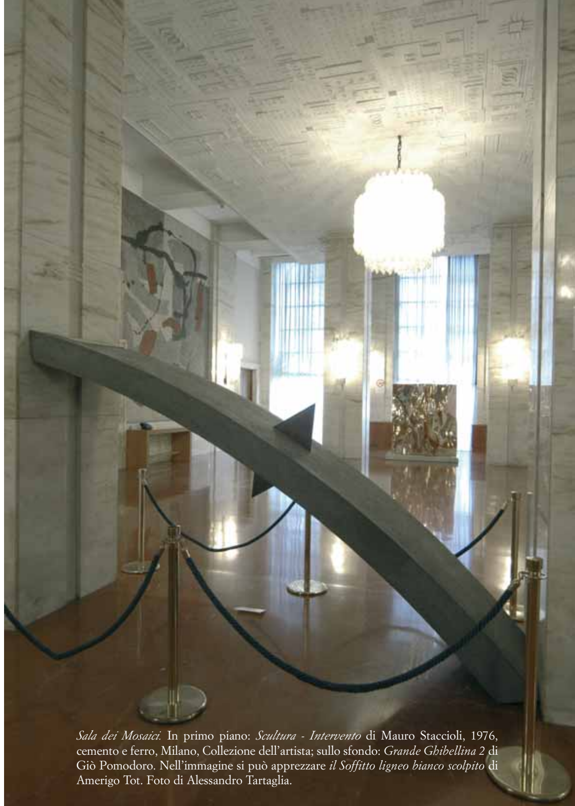
Sala dei Mosaici . In primo piano: Scultura - Intervento di Mauro Staccioli, 1976, cemento e ferro, Milano, Collezione dell'artista; sullo sfondo: Grande Ghibellina 2 di Giò Pomodoro. Nell'immagine si può apprezzare il Soffitto ligneo bianco scolpito di Amerigo Tot.